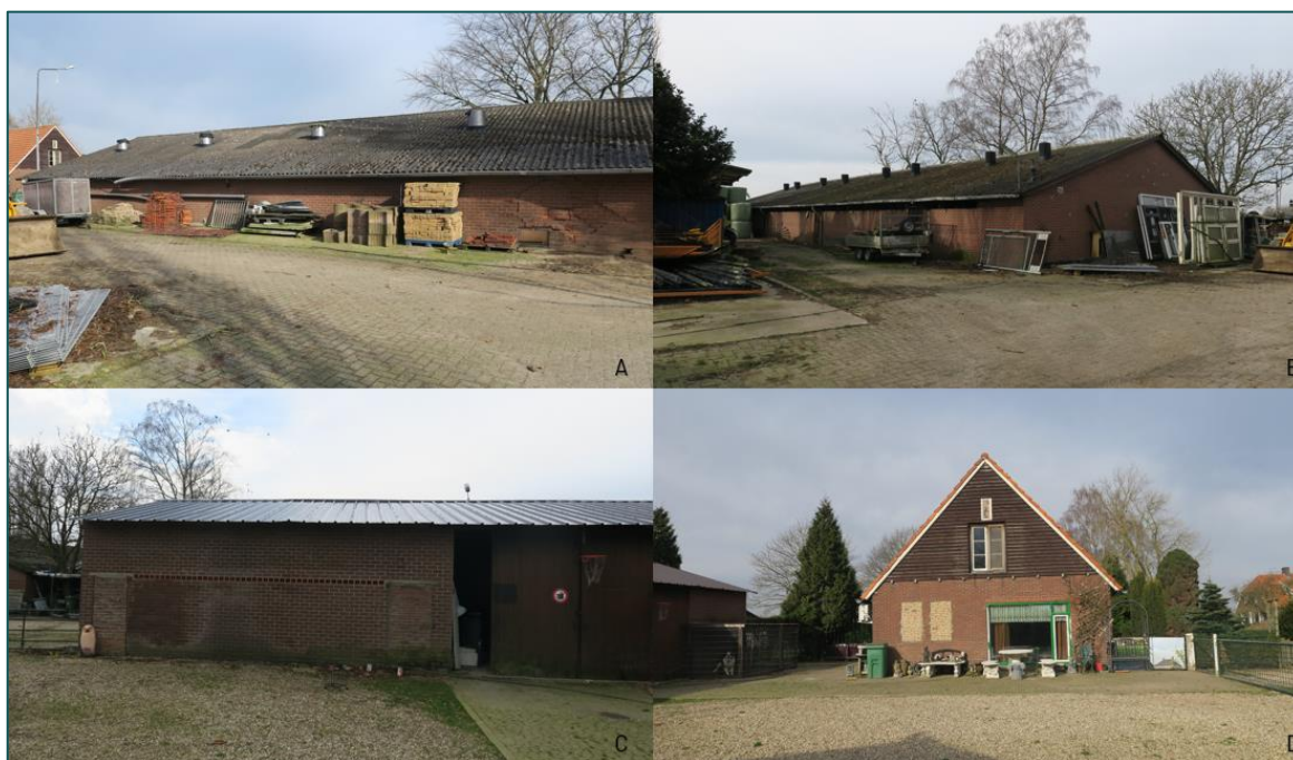
Figuur 1.1 De planlocatie is gelegen te Van Rouwenootweg 56 te Didam. Men is voornemens om twee stallen (A&B) en een schuur (C) te slopen. De woning (D) blijft behouden.