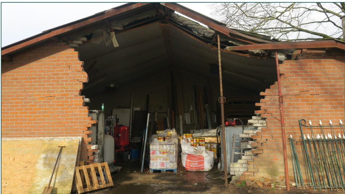
Figuur 3.1 Het dak en de luchtspouw van stal A ligt deels open.

Stal B is opgebouwd uit gemetselde muren met een golfplaten dak waar dupanel platen tegen zijn bevestigd. In stal B zijn geen openingen aanwezig welke vleermuizen toegang kunnen verlenen tot de dakruimte. Stal A en B bevatten een spouwmuur. De muur van stal A ligt grotendeels open, in dit deel van de luchtspouw is sprake van tochtwerking en is derhalve niet geschikt als verblijfplaats voor vleermuizen (figuur 3.1).