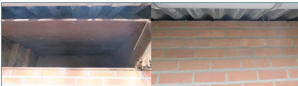
Figuur 3.3 Onder het dak van stal B is geen ruimte aanwezig welke huismussen toegang kunnen verlenen tot de stal (links), onder het dak van stal A is deze ruimte wel aanwezig (rechts).

De gierzwaluw heeft als oorspronkelijk rotsbewoner de rotsen ingeruild voor bebouwing. De soort broedt daardoor hoofdzakelijk in stedelijk gebied in donkere holtes van ventilatieschachten, spleten in muren en onder (pannen)daken (BIJ12 kennisdocument Gierzwaluw, 2017). Doordat de soort niet direct vanuit zijn nest kan opstijgen, moet hij zich naar beneden kunnen laten vallen. Het nest dient hierdoor een vrije aanvliegroute van minimaal 1 meter breed, en minimaal 3 meter onder de nestopening te bevatten. Hierbij dienen zo min mogelijk belemmerende elementen, zoals bomen, aanwezig te zijn. Voedselvluchten kunnen op vele kilometers (tot wel 1000 km) van het nest plaatsvinden, waardoor het foerageergebied niet nader te definiëren is. De planlocatie is gelegen in landelijk gebied. De daken van de te slopen stallen en schuur bestaan uit golfplaten of metalen damwandplaten daken waar dupanel platen tegen bevestigd zijn. De openingen welke in stal A leiden tot de dakruimte bevinden zich op een hoogte van circa 1,75 m, waardoor er geen vrije aanvliegroute aanwezig is. Tevens is de planlocatie gelegen in landelijk gebied waar nestlocaties van de gierzwaluw aanzienlijk minder worden waargenomen. In stal B en schuur C zijn geen openingen aanwezig welke de gierzwaluw toegang kan verlenen tot de dakruimte. Hierdoor kan de aanwezigheid van nestlocaties van de gierzwaluw in de te slopen bebouwing uitgesloten worden.