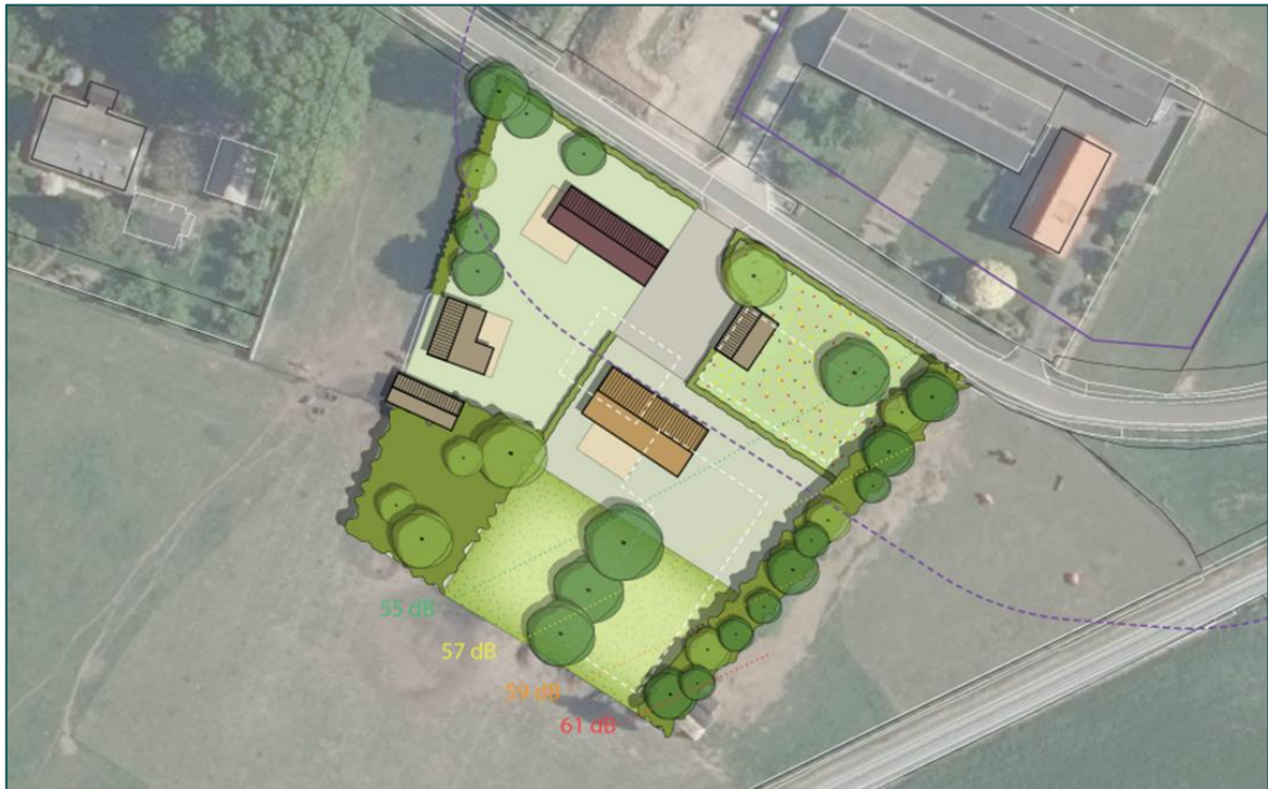
Figuur 1.3 Visuele representatie van de beoogde situatie.