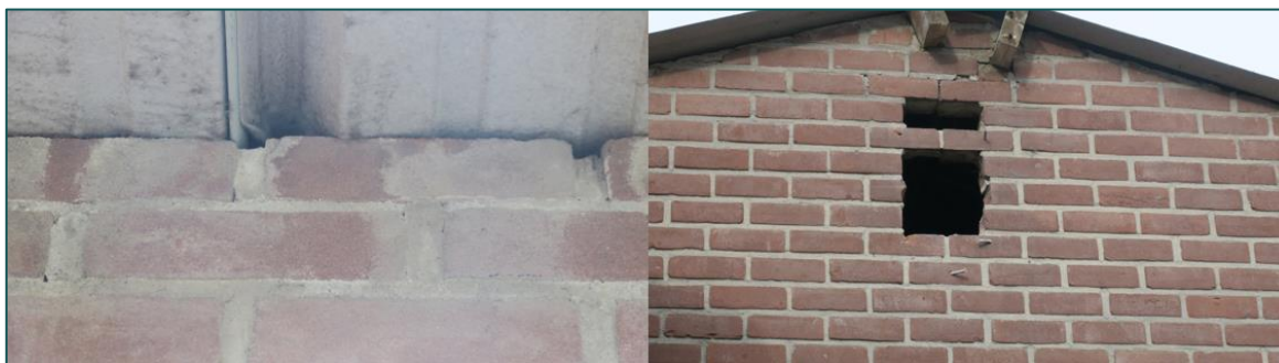
Figuur 3.2 De opening tussen het dak en de muur (links) en de opening in de muur welke leidt tot de zolder van schuur C (rechts). Deze openingen kunnen vlemuizen toegang verlenen tot de bebouwing.

Onder het golfplaten dak van stal A is een ruimte aanwezig welke vlemuizen toegang kunnen verlenen tot de spouwmuur en de dakruimte. Schuur C is opgebouwd uit gemetselde muren met een luchtspouw en een metalen damwandpanelen dak waartegen dupanel platen zijn bevestigd. Het dak sluit niet volledig aan op de muur, waardoor vlemuizen toegang kunnen krijgen tot de spouwmuur en de dakruimte. Tevens is er aan de oostzijde van de schuur een opening in de muur aanwezig welke grootoorvlemuizen toegang kunnen verlenen tot de zolder van de schuur (figuur 3.2). Derhalve is de aanwezigheid van verblijfplaatsen van gebouwbewonende vlemuizen in stal A en schuur C op de planlocatie is niet uit te sluiten. Om de aan- of afwezigheid van verblijfplaatsen van vlemuizen in de te slopen bebouwing op de planlocatie vast te stellen dient aanvullend onderzoek plaats te vinden (zie H5.3).