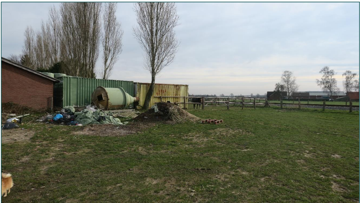
Figuur 4 De omgeving van de planlocatie bestaat uit agrarisch gebied.