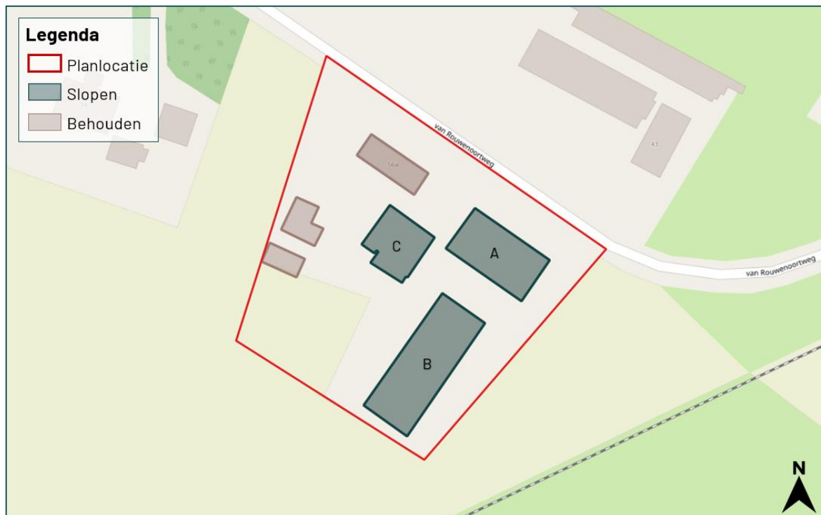
Figuur 1.2 De planlocatie (rood omkaderd) is gelegen aan de Van Rouwenortweg 56 te Didam.

De planlocatie is gelegen aan de Van Rouwenortweg 56 te Didam (figuur 1.2). De planlocatie bestaat uit een verhard erf waarop verschillende schuren en stallen staan. In de beoogde ruimtelijke ingreep worden twee stallen en een schuur gesloopt. Allen zijn opgebouwd uit gemetselde muren met een luchtspouw en een golfplaten dak. De daken van stal A en B bestaan uit golfplaten daken waar dupanel platen aan de onderzijde zijn bevestigd. Het dak van schuur C bestaat uit een metalen damwandplaten dak waar dupanel platen tegen de onderzijde zijn bevestigd. De stallen zijn niet meer in gebruik. In figuur 1.3 en bijlage 1 zijn een aantal foto's opgenomen die een impressie geven van de planlocatie en de directe omgeving hiervan.