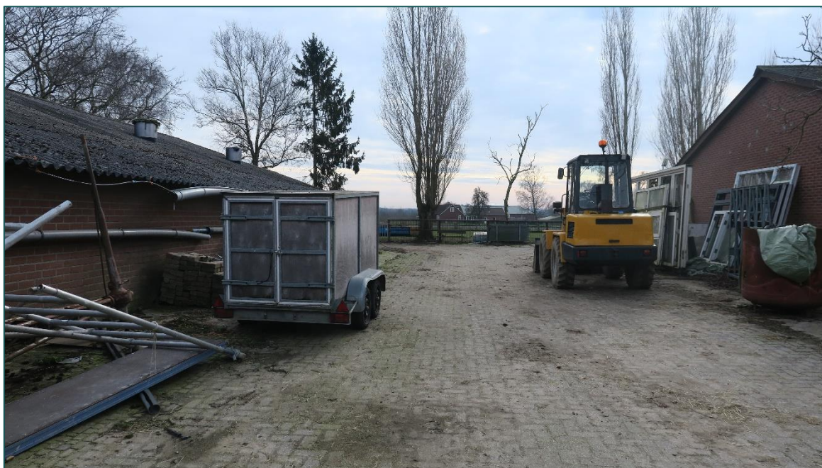
Figuur 1 De planlocatie is gelegen aan de Van Rouwenortweg 56 te Didam.