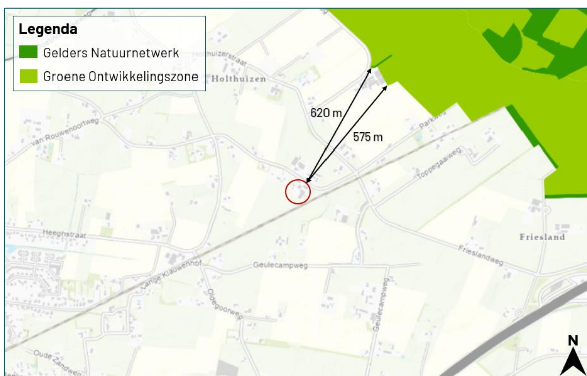
Figuur 3.5 De planlocatie ligt op een afstand van circa 620 m tot het Gelders Natuurnetwerk en op een afstand van circa 575 m tot de Groene Ontwikkelingszone.

De planlocatie maakt geen deel uit van een beschermd gebied betreffende het Gelders Natuurnetwerk, Groene Ontwikkelingszone, Weidevogelgebied, Ganzenrustgebied of Beschermingszone natte landnatuur. Op een afstand van circa 620 m ligt het Gelders Natuurnetwerk en op een afstand van circa 575 m ligt de Groene Ontwikkelingszone (figuur 3.5). Op een afstand van circa 5,8 km ligt het Weidevogelgebied en op een afstand van circa 7 km van de planlocatie ligt het Ganzenrustgebied (geen kaartweergave). Op een afstand van circa 6,7 km ligt de Beschermingszone natte landnatuur (geen kaartweergave). Ten aanzien van provinciaal aangewezen gebieden geldt dat externe werking geen toetsingskader is.