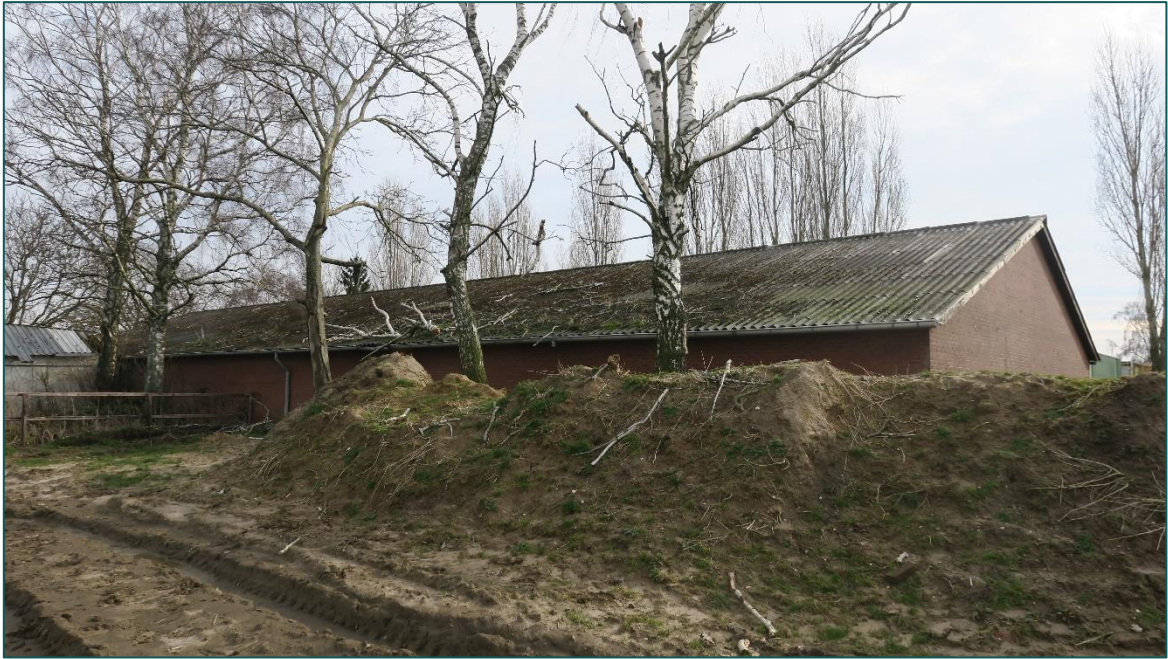
Figuur 3 De westzijde van stal B.