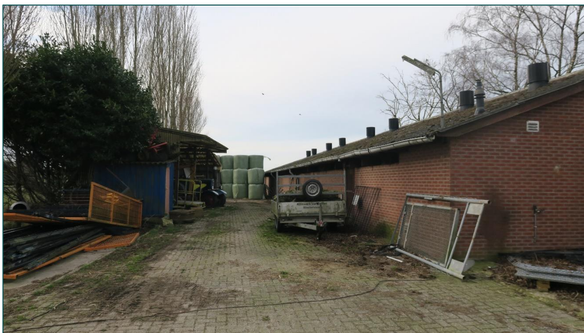
Figuur 2 Het terrein van de planlocatie met stal B.