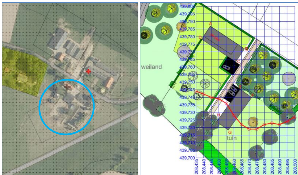
Figuur 1 en 2: situering locatie en beoogde invulling perceel (indicatief)