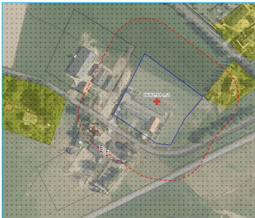
Figuur 3: contour van 50 meter rondom veehouderij Van Rouwenoortweg 43

Er zijn in dit geval geen bijzondere omstandigheden die tot een ander oordeel leiden. In de directe omgeving zijn geen andere veehouderijen aanwezig, zodat de achtergrondbelasting 2 niet leidt tot de conclusie dat geen sprake is van een aanvaardbaar woon- en leefklimaat. Dat geldt ook als voor een andere situering van de woning wordt gekozen. Voorwaarde daarbij is logischerwijs wel, dat moet worden voldaan aan de minimumafstand van 50 meter. Bij het niet voldoen aan de minimumafstand van 50 meter (gemeten vanuit de rand van het agrarisch bouwvlak) is geen sprake van een goede ruimtelijke ordening en kan geen medewerking aan de realisatie van de nieuwe woning worden verleend.