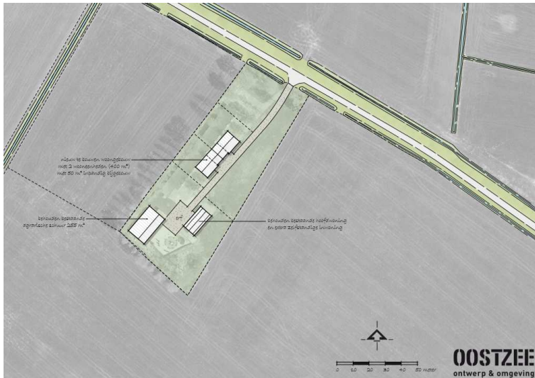
Wenselijke nieuwe eindbeeld van het plangebied.

Het voornemen bestaat om de bestaande bebouwing te slopen en een woongebouw met twee wooneenheden te bouwen op de plek waar de kippenstal staat. Na de bouw wordt het erf landschappelijk ingepast. Op onderstaande afbeelding wordt het wenselijke eindbeeld weergegeven.