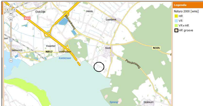
Ligging van Natura2000-gebied nabij het plangebied. De ligging van het plangebied wordt aangeduid met de cirkel. Natura2000-gebied wordt met de groene arcering aangeduid.