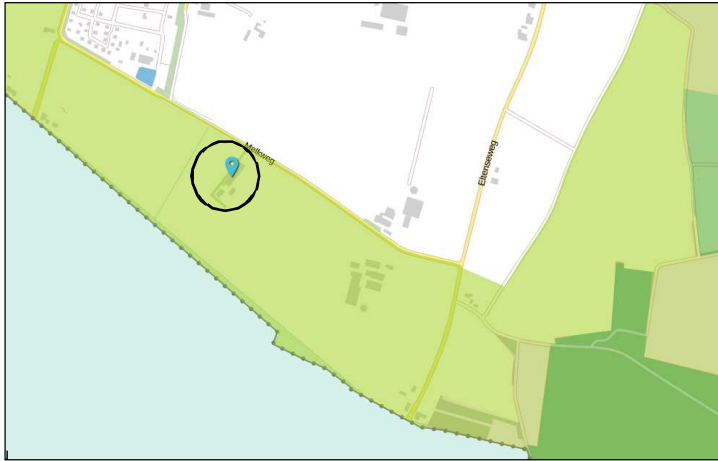
Ligging van Gelders Natuurnetwerk in de omgeving het plangebied. De ligging van het plangebied wordt met de cirkel aangeduid.