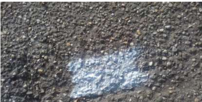
Pakmarker locatie 3

Hoonstra Infrabouw Postbus 92 6980 AB Doesburg Telefoon: 0313 47 61 00