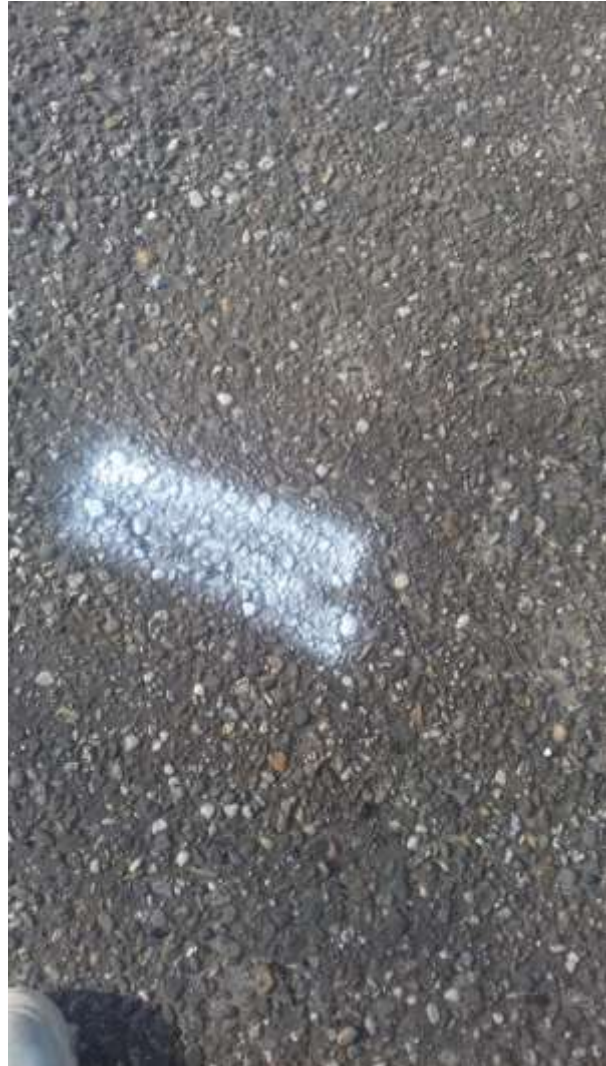
Pakmarker locatie 2