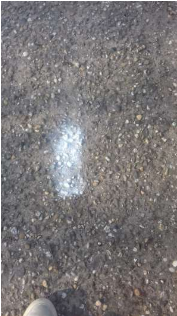
Pakmarker locatie 1