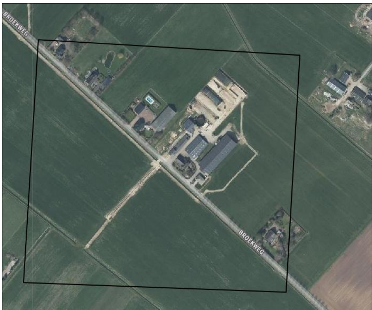
Verspreiding van alle bekende records in het plangebied.

Op 17 september 2023 is de NDFD geraadpleegd en is gekeken of waarnemingen van beschermde planten en dieren aanwezig zijn in de databank. In een ruime begrenzing van het zoekgebied rondom het plangebied, zijn geen waarnemingen bekend in de NDFD. De luchtfoto onder toont het plangebied.