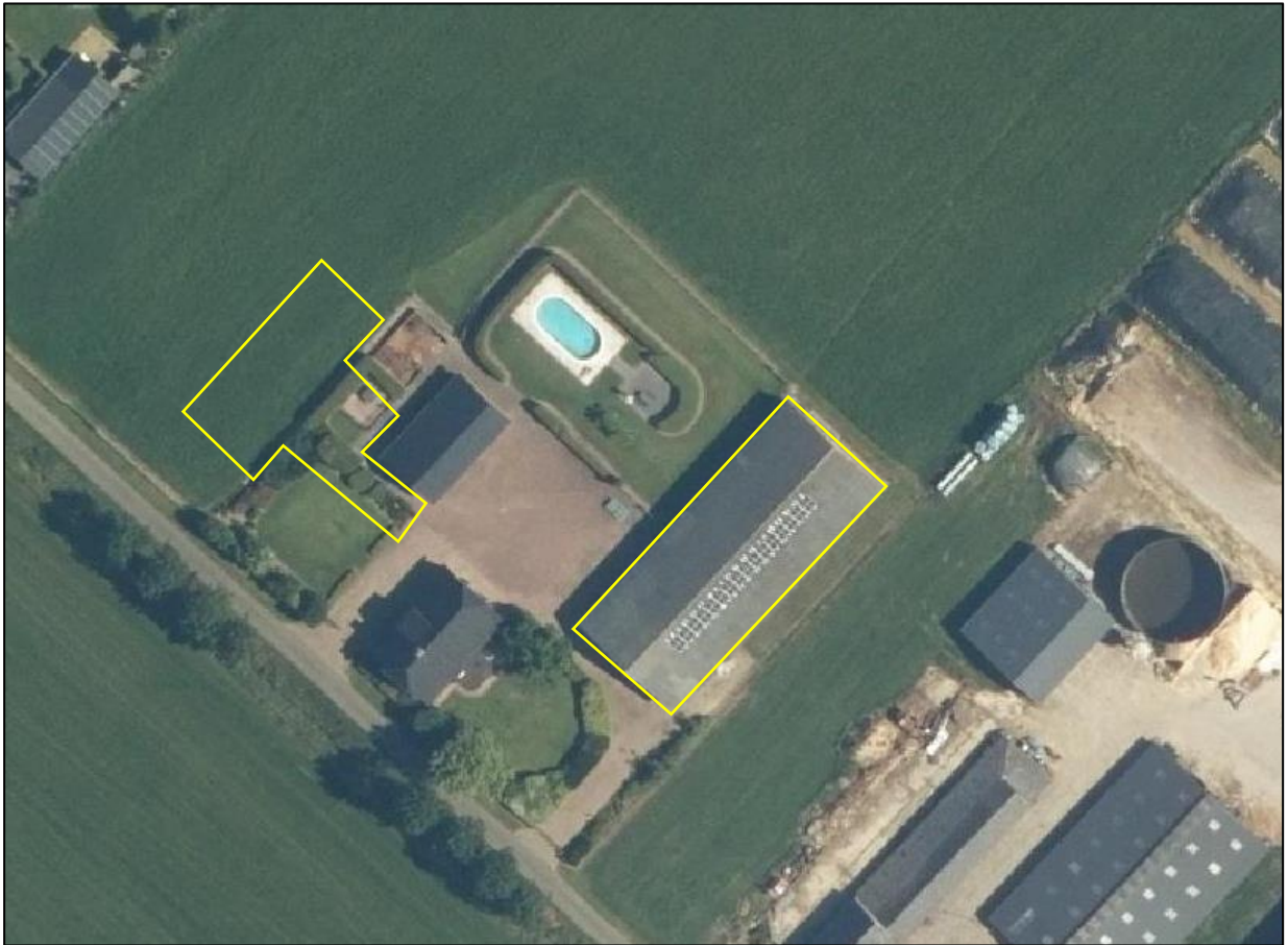
Begrenzing van het plangebied; deze wordt met de gele lijn aangeduid (bron luchtfoto: ruimtelijkeplannen.nl).

Het plangebied bestaat uit een deel van een erf en een deel van intensief beheert agrarisch grasland. Het erf bestaat uit een vrijstaande woning, bijgebouw, een rijhal, erfverharding en erfbeplanting. Het plangebied bestaat uit de rijhal, de beplanting in de tuin en een deel van het grasland. De rijhal bestaat uit gemetselde binnen- en buitengevels met spouw en een dak dat bestaat uit golfplaten. Naast het bijgebouw is beplanting in de vorm van een laurierhaag en enkele sierplanten aanwezig. Het plangebied grenst aan erfbeplanting, het bijgebouw en agrarisch cultuurlandschap. Op onderstaande luchtfoto is de begrenzing van het plangebied aangegeven. Voor een impressie van het plangebied wordt verwezen naar de fotobijlage.