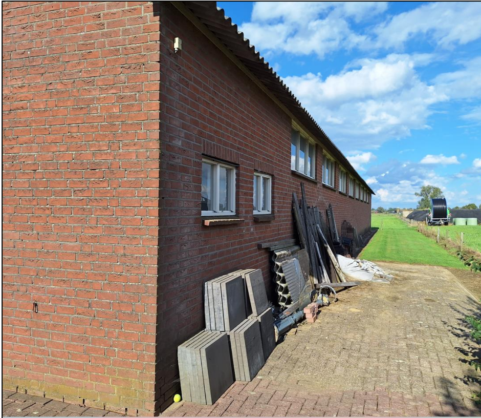
Bosmuis en huisspitsmuis kunnen een vaste rust- en voortplantingsplaats onder opgeslagen goederen in de buitenruimte bezetten.

Door het uitvoeren van de voorgenomen activiteiten wordt mogelijk een grondgebonden zoogdieren gedood en wordt mogelijk een vaste rust- en/of voortplantingsplaats beschadigd en vernield. De betekenis van het onderzoeksgebied als foerageergebied voor grondgebonden zoogdieren neemt niet af.