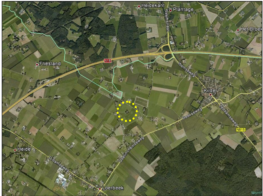
Globale ligging plangebied