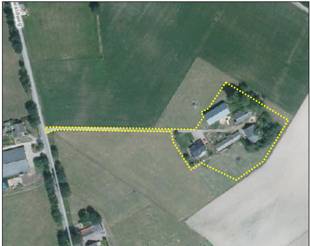
Globale begrenzing plangebied