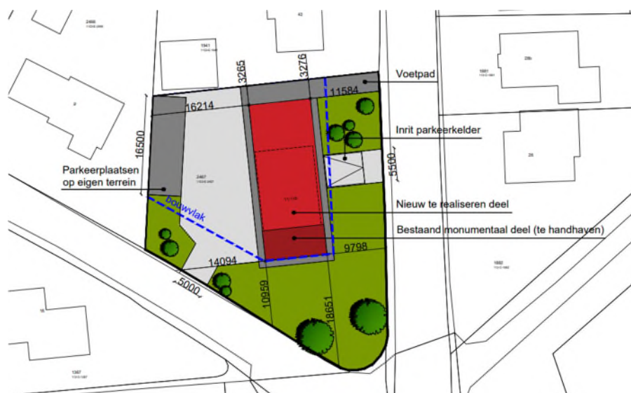
Afbeelding. 3. Verbeelding van het wenselijke eindbeeld (bron: VanVugt, 2022).

De volgende activiteiten worden getoetst op relevantie t.a.v. de Wet natuurbescherming: