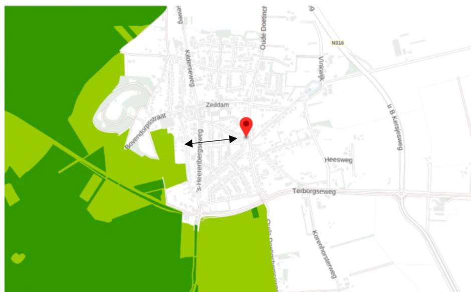
Afbeelding. 4. Ligging plangebied t.o.v. GNN en GO.

Het plangebied ligt buiten het Gelders Natuurnetwerk, Groene ontwikkelingszone, natte landnatuur, Weidevogelgebied en Ganzenrustgebied. Gronden die tot de Groene ontwikkelingszone behoren liggen op minimaal 390 meter afstand van het plangebied. In afbeelding 4 wordt de ligging van de Groene ontwikkelingszone (lichtgroene kleur) en het Gelders Natuurnetwerk (donkergroene kleur) in de omgeving van het plangebied (rode marker) weergegeven. Gronden die tot de natte landnatuur, Weidevogelgebied en Ganzenrustgebied behoren liggen op minimaal 6,2 kilometer afstand.