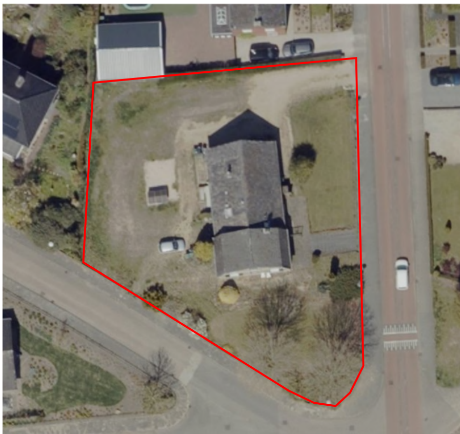
Afbeelding. 2. Begrenzing van het plangebied.