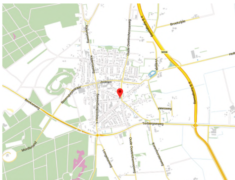
Afbeelding. 1. Globale ligging van het plangebied.

Het plangebied is gesitueerd aan de Vinkwijkseweg 11 in de provincie Gelderland in het dorp Zeddam, welke in de gemeente Montferland is gelegen. Ten noorden van het plangebied bevindt zich het centrum van Zeddam en verder is het plangebied omgeven door stedelijk gebied. In afbeelding 1 wordt de globale ligging van het plangebied (rode marker) weergegeven op een topografische kaart.