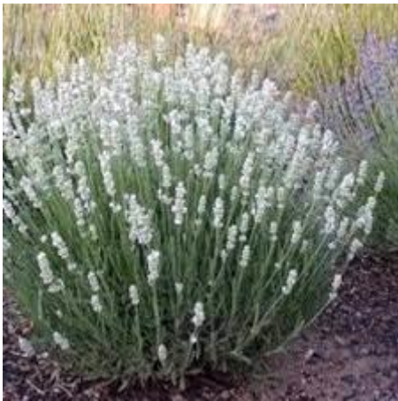
35: Lavendula angustifolia 'muntstead' (lavendel)