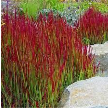
27: Molinia Moorhexe (pijpenstrootje)