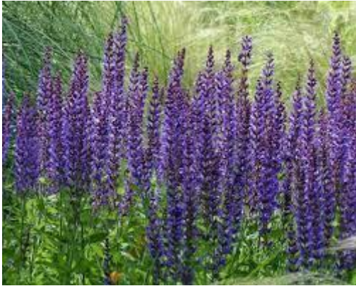
37: Salvia verticillata Purle rain (kransalie)