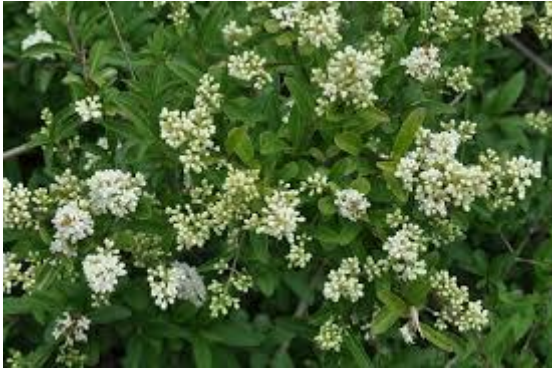
9: Daphne mezereum (rood peperboompje)