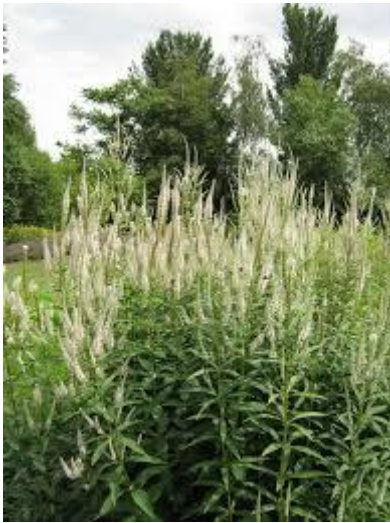
24: Calamagrostis acu (struisriet)