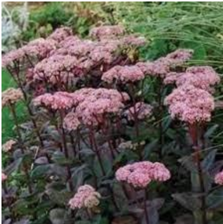
22: Stipa gigantea (reuzenvedergras)