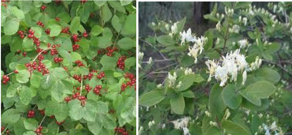
12 : Cornus sanguinea ( rode kornieltje)