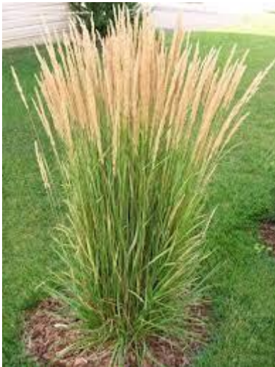
25: Miscanthus sinensis (sierriet)