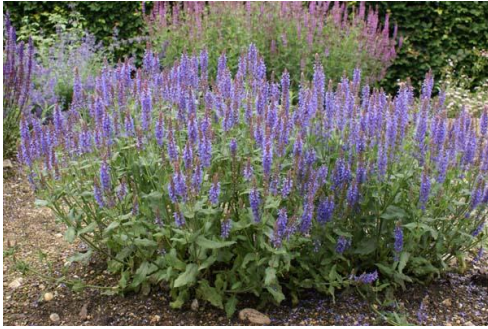
5: Persicaria 'JS Caliente' (Duizendknoop)