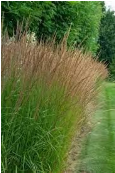
28: Pennisetum alopecuroides (lampepoetsgras)