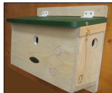
Figuur 4: Mussenkast ( www.vivara.nl )

http://www.haagsevogels.nl/cms/index.php?page=mussenflat-bouwen