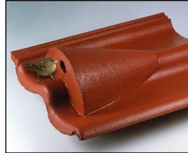
Figuur 2: Mussendakpan

Het bedrijf Waveka verkoopt speciale Huismussendakpannen en grote dakpanfabrikanten als Lafarge en Koramic kunnen door hen gemaakte dakpantypen op verzoek uitvoeren in een nestpan-variant voor Huismussen (ronde opening), hoewel dit niet voor alle typen kan.