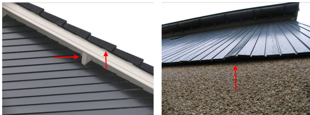
Afbeelding 3: potentiële verblijfplaatsen van gebouwbewonende soorten vleermuizen.

de windveer en gevelpannen zijn ruimtes aanwezig, waar vleermuizen tussen kunnen kruipen (afbeelding 4). Negatieve effecten op vaste rust- en verblijfplaatsen van gebouwbewonende soorten vleermuizen kunnen niet op voorhand worden uitgesloten.