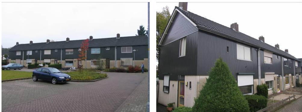
Afbeelding 2: Impressie van het plangebied.