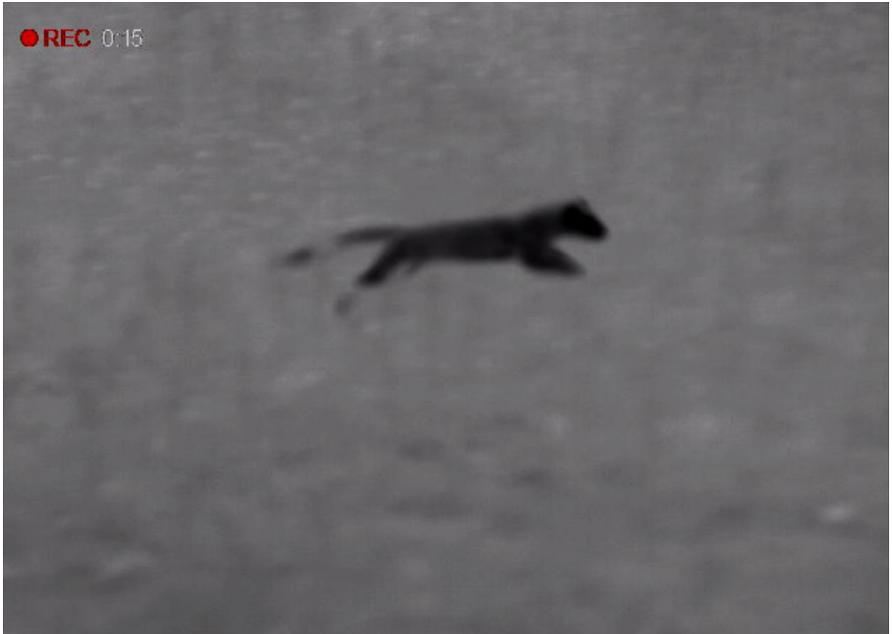
Afbeelding 5: jonge steenmarter nabij de sporthal de Meikever op 28 mei 2020.

Bij het onderzoek op 28 mei 2020 is bij de sporthal de Meikever een jonge steenmarter aangetroffen. Het dier was hier door het lange gras aan het rennen en verdween langs de beplanting in zuidelijke richting.