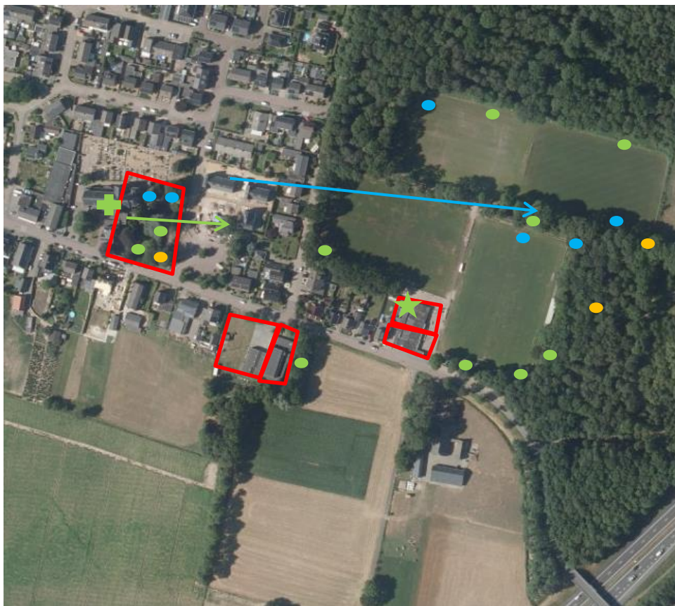
Afbeelding 2: visualisatie van de aangetroffen dieren, tijdens het onderzoek in het voorjaar. Gewone dwergvleermuis, groen: stip foeragerend, ster zomerverblijf, kruis kraam- of groot zomerverblijf, pijl vliegroute; Laatvlieger, blauw, stip foeragerend, pijl vliegroute; Gewone grootoorvleermuis: oranje, stip foeragerend.

Daarnaast zijn foeragerende gewone dwergvleermuizen ( Pipistrellus pipistrellus ), gewone grootoorvleermuizen ( Plecotus auritus ) en laatvliegers ( Eptesicus serotinus ) aangetroffen. De dieren zijn foeragerend in de tuin van de pastorie en langs de beplantingsranden van de sportvelden. Rondom de sporthal zijn vrijwel geen foeragerend vleermuizen aangetroffen. Op 27 mei zijn ruim 15 gewone dwergvleermuizen waargenomen die vanuit de kerk in oostelijke richting verdwenen. Op alle avonden zijn langs de rij bomen op het portpark langs vliegende laatvliegers aangetroffen.