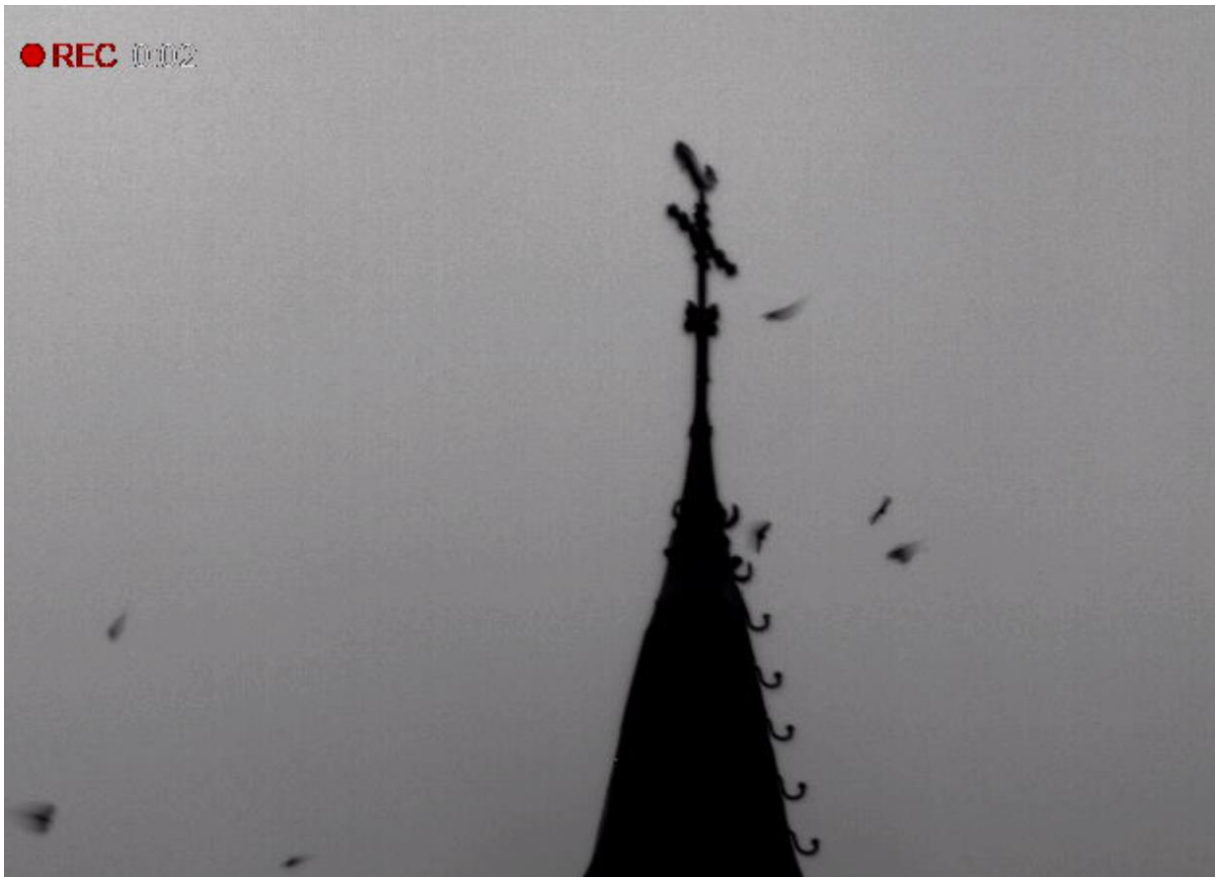
Afbeelding 4: Zwermende gewone dwergvleermuizen bij de torenspits van de kerk rond 23.00 op 21 september 2020.