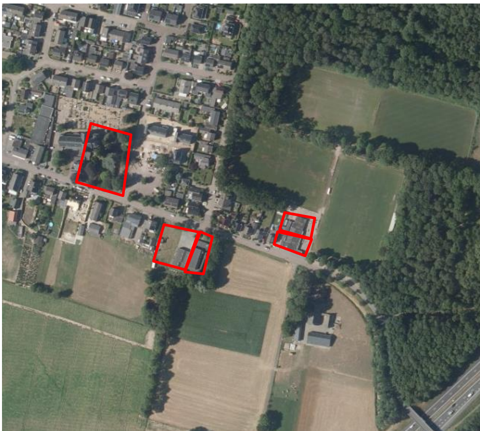
Afbeelding 1: ligging van de onderzochte locatie, de onderzoek clusters zijn met een rode lijn omcirkeld.