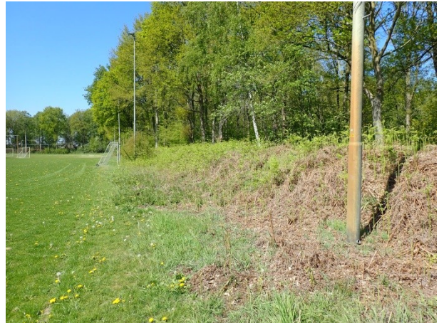
Foto 17: links, de dubbele rij bomen gezien van af de Meikamerlaan met links een van de grassportvelden.