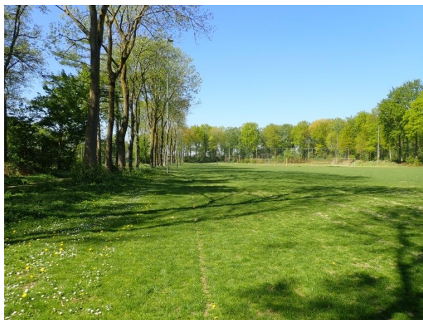
Foto 21: links, het grassportveld waarop de accommodatie moet komen met rechts de dubbele bomenrij Foto 22: rechts, het grassportveld dat wordt aangepast met aan de rechterzijde de grondwal waarop de levendbarende hagedis is aangetroffen.