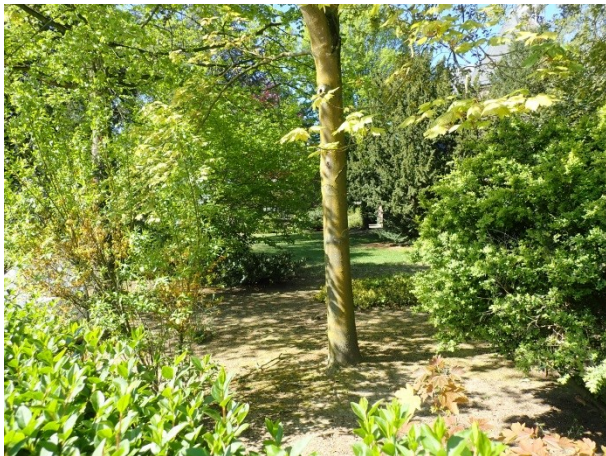
Foto 2: rechts, de tuin gezien vanaf de Mariakapel in de richting van de begraafplaats.