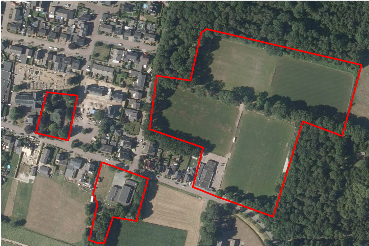
Afbeelding 1: ligging van het plangebied. Het plangebied is met rode lijnen omcirkeld.