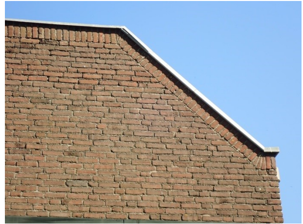
Foto 5: links, zijkant van de sporthal met in de muur open stootvoegen en bij de schoorsteen loodslabben.