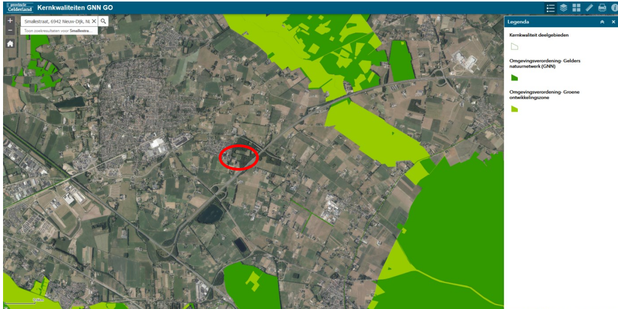
Afbeelding 3: ligging van het plangebied ten opzichte van GNN en GO gebieden (rode cirkel).

Het plangebied ligt niet in de GNN of GO zones van het Gelders Natuur Network. Onderdelen van dit netwerk liggen op grotere afstand van het plangebied.