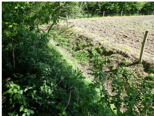
Foto 12: rechts, de droge sloot tussen het naburige perceel en de strook met bomen bij de sporthal.