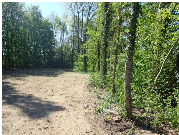
Foto 11: links, het recentelijk ingezaaide grasveld met de omringede bomen.