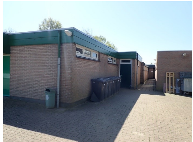
Foto 14: rechts, de kleedkamers met de veiligheidsverlichting