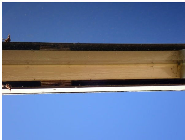
Foto 10: rechts, de opening achter het boeideel boven het kozijn.