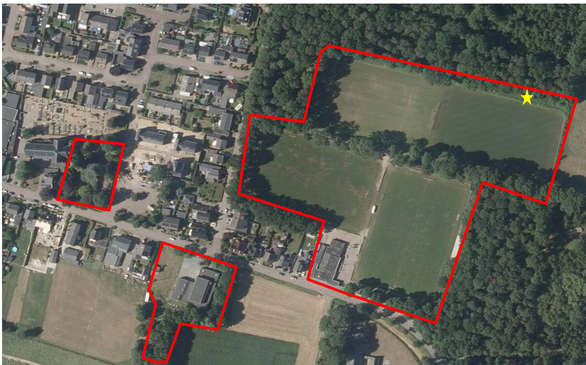
Afbeelding 4: de plaats waar de aangetroffen levendbarende hagedis is aangetroffen, is aangegeven met een gele ster.

De wet natuurbescherming wordt mogelijk overtreden voor de soorten levendbarende hagedis en hazelworm indien bij de werkzaamheden aan het sportveld ook de voorberm en grondwal langs het bestaande veld moet worden gebruikt. Nader onderzoek is op dat moment noodzakelijk. In alle andere gevallen volstaat een werkprotocol.