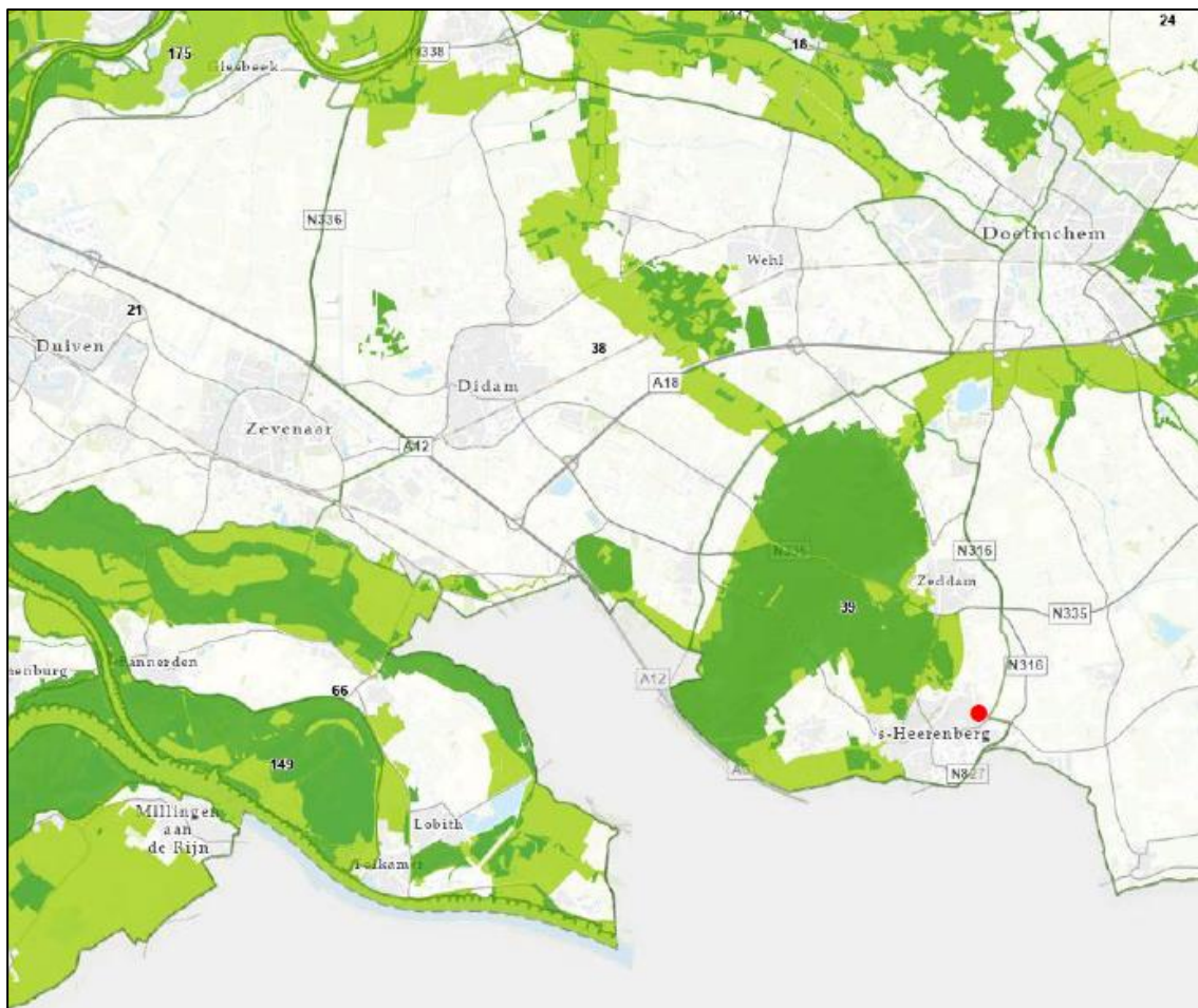
Ligging van het plangebied ten opzichte van het Gelders Natuurnetwerk (donkergroen) en de Groene Ontwikkelingszone (lichtgroen). De locatie van het plangebied is met een rode marker aangegeven.

Vanwege de ligging buiten het GNN en de GO, hoeft het initiatief niet getoetst te worden aan beleidsregels voor de bescherming van het GNN en de GO, omdat de bescherming van hiervan geen externe werking kent.