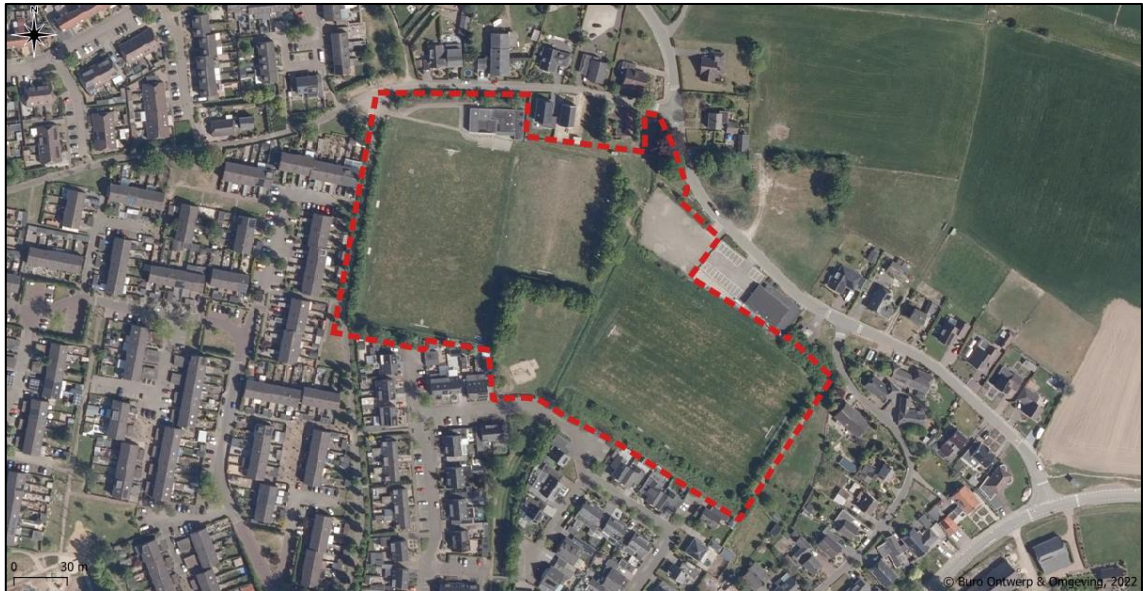
Globale begrenzing plangebied