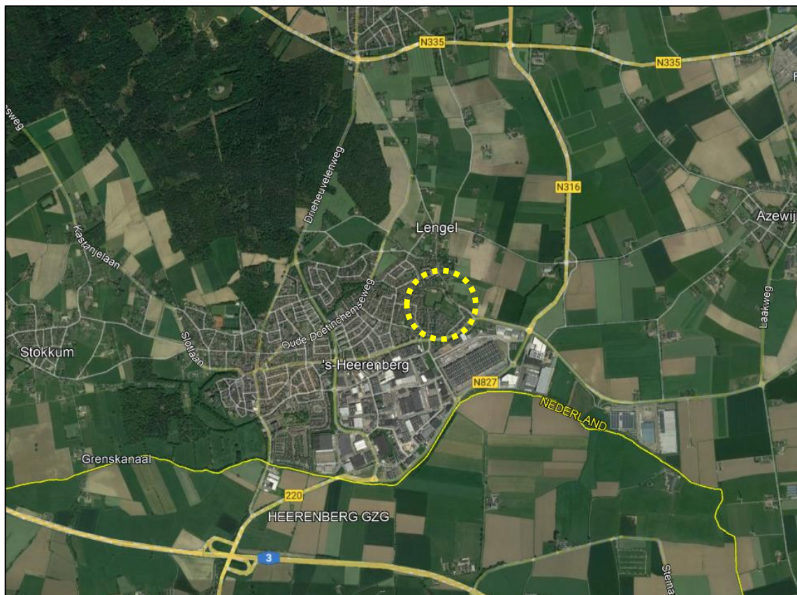
Globale ligging plangebied

Op de navolgende afbeeldingen zijn de globale ligging en begrenzing van het plangebied weergegeven.