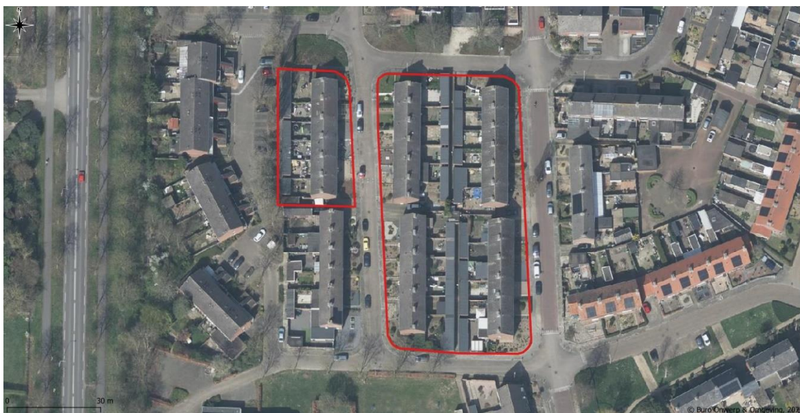
Figuur 1. Ligging van het projectgebied (rood kader).