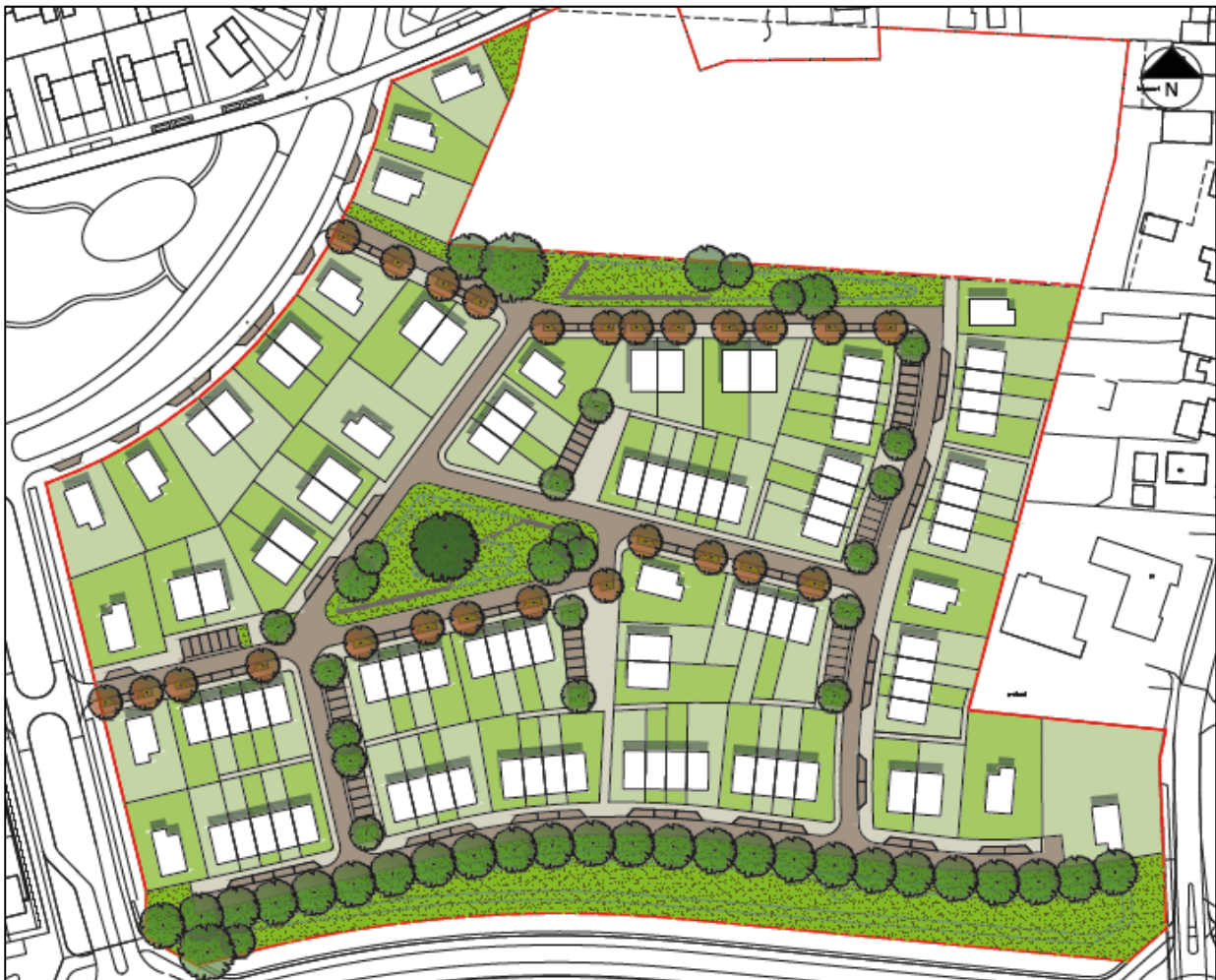
Figuur 2: Stedenbouwkundig ontwerp

In de onderstaande figuur is het stedenbouwkundige ontwerp 2 van plan weergegeven: