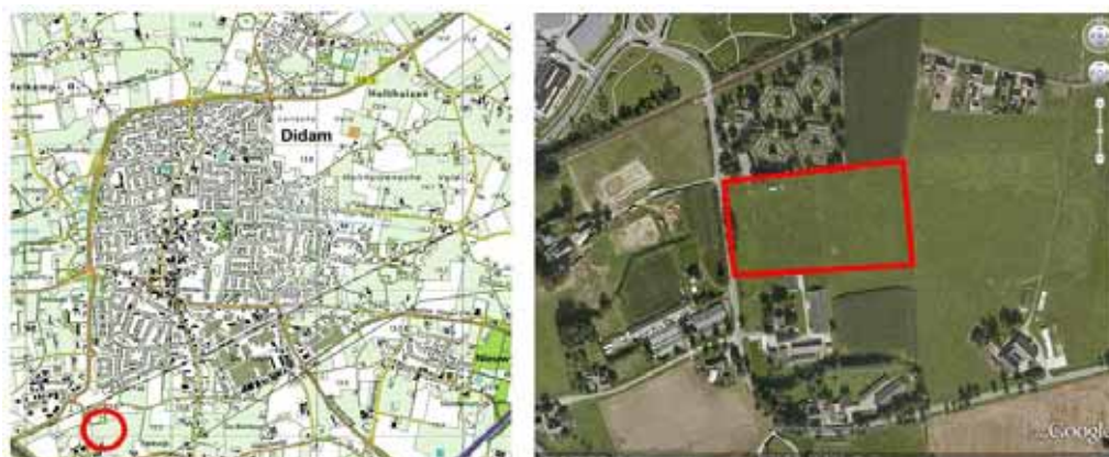
Figuur 1: links: uitsnede uit topografische kaart (oorspronkelijke schaal 1:25.000). Rechts, luchtfoto (Google Earth). De rode omlijning geeft de ligging van het plangebied weer.

Didam (Gemeente Montferland) is gelegen in de provincie Gelderland ten oosten van Arnhem. Didam is gelegen in een overwegend agrarische omgeving. Het plangebied bevindt zich buiten de bebouwde kom aan de zuidzijde van Didam ten zijde van de begraafplaats. Tussen het plangebied en de bebouwde kom van Didam ligt een spoorlijn (figuur 1).