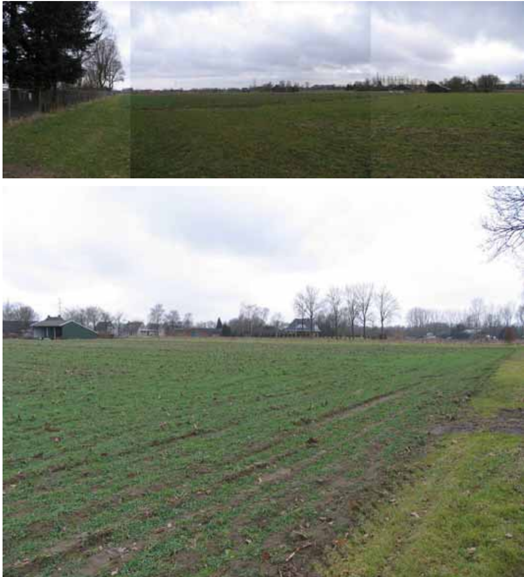
Figuur 2: Impressie van het plangebied. Agrarisch beheer