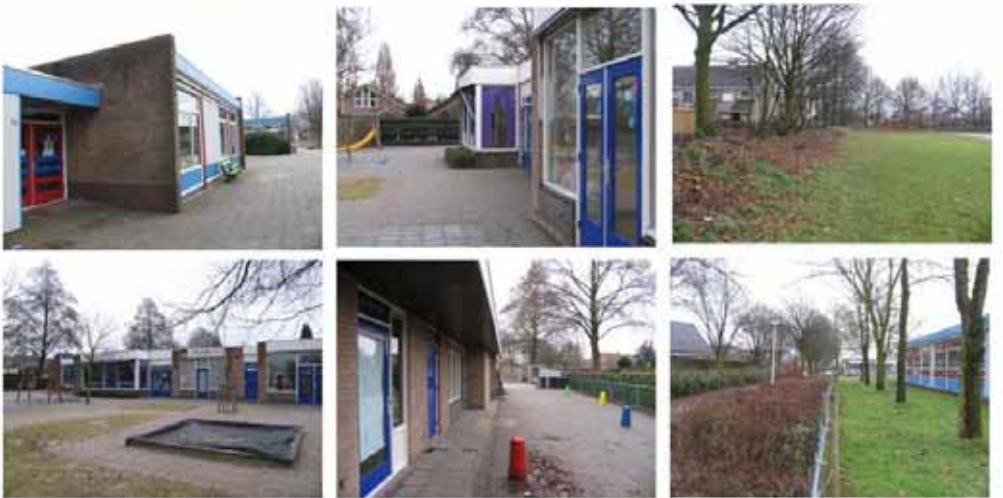
Figuur 2: Impressie van het plangebied.