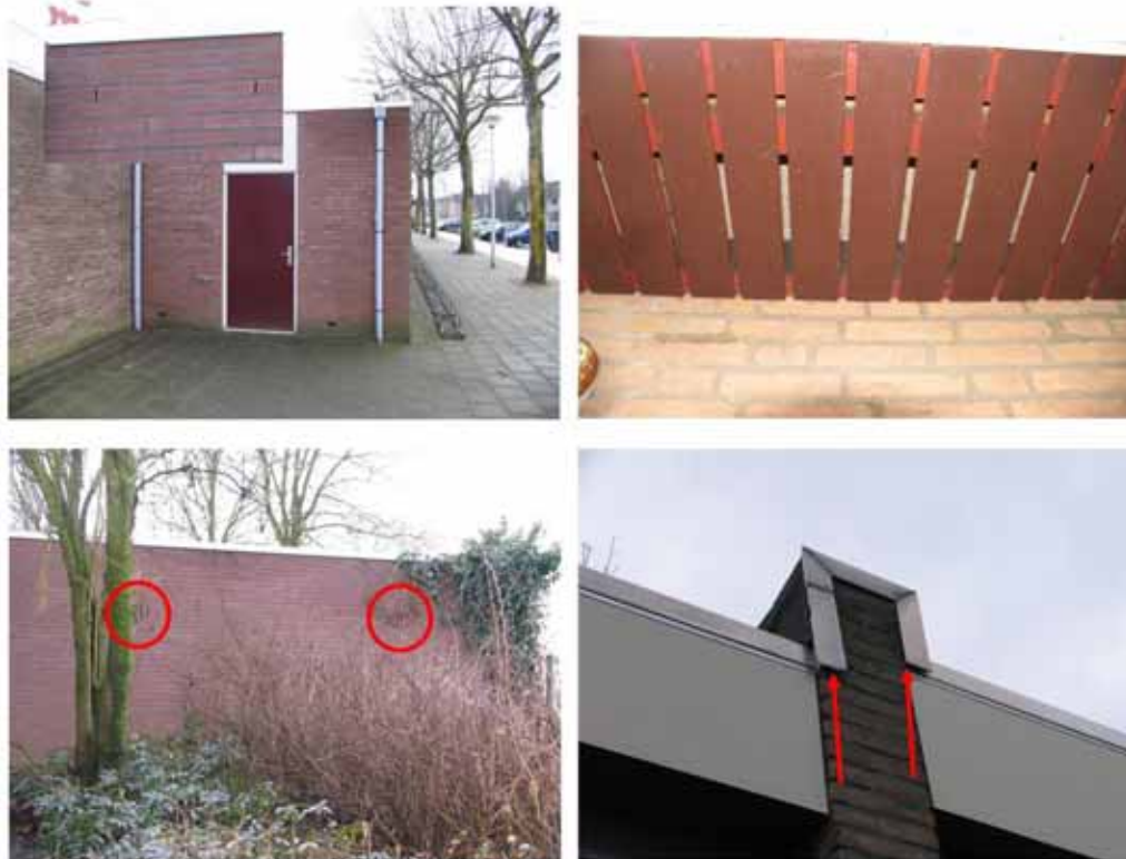
Afbeelding 3: mogelijke toegangsopeningen tot geschikte schuilplaatsen voor vleermuizen. Linkerzijde: spouwmuren met open stootvoegen of ventilatievoegen. Rechtsboven: overkapping aan de onderzijde op veel plaatsen zeer toegankelijk. Rechtsonder: kieren die mogelijk toegang bieden tot spouwruimtes.