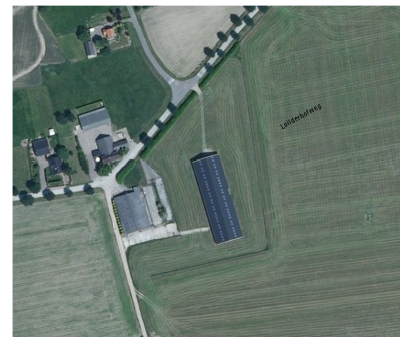
luchtfoto bestaande situatie