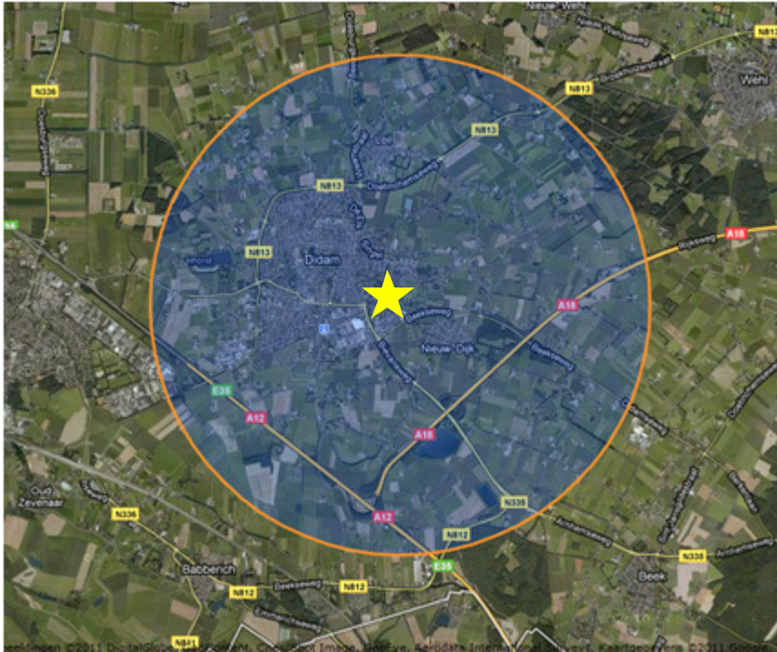
Afb. 3. De ligging van Natura2000-gebieden, beschermde natuurmonumenten en Wetlands in een straal van 3 km rondom het studiegebied. Het studiegebied wordt aangeduid met de ster.

Er liggen géén N2000-gebieden in een straal van 3 km. Rondom het studiegebied ( bron Min. EL&I 2011 ).