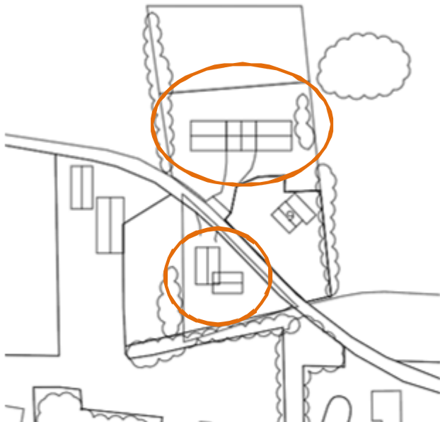
Afb. 2. Weergave van de bouwplannen op perceel Oude Zandweg 6. De nieuw te bouwen woningen worden met de cirkel aangeduid.

Vanwege de aard van de werkzaamheden wordt de beoogde ingreep niet gezien als een (significant aantoonbare) aantasting van foerageermogelijkheden en/of migratie- en foerageerroutes van vleermuizen. Er worden geen lijnvormige structuren zoals houtingels of laanbeplanting verwijderd, die mogelijk als verbindende schakel functioneren in het leefgebied van vleermuizen en er worden geen forse nieuwe structuren/objecten opgericht die mogelijk een belemmering vormen.