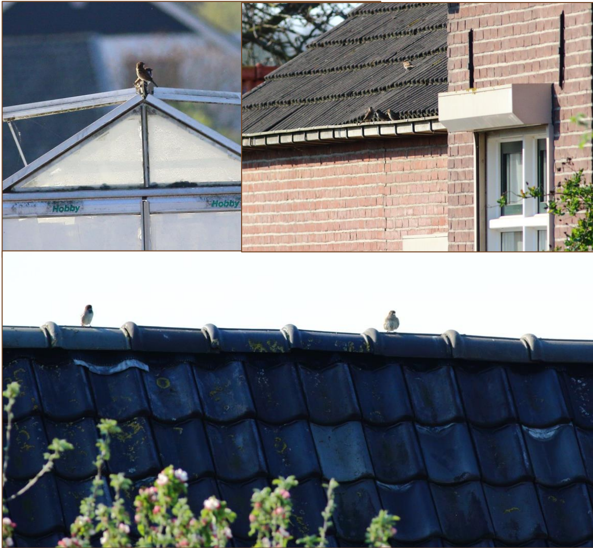
Foto 2 t/m 4. Kolonie huismussen bij de Doetinchemseweg 12 t/m 14.