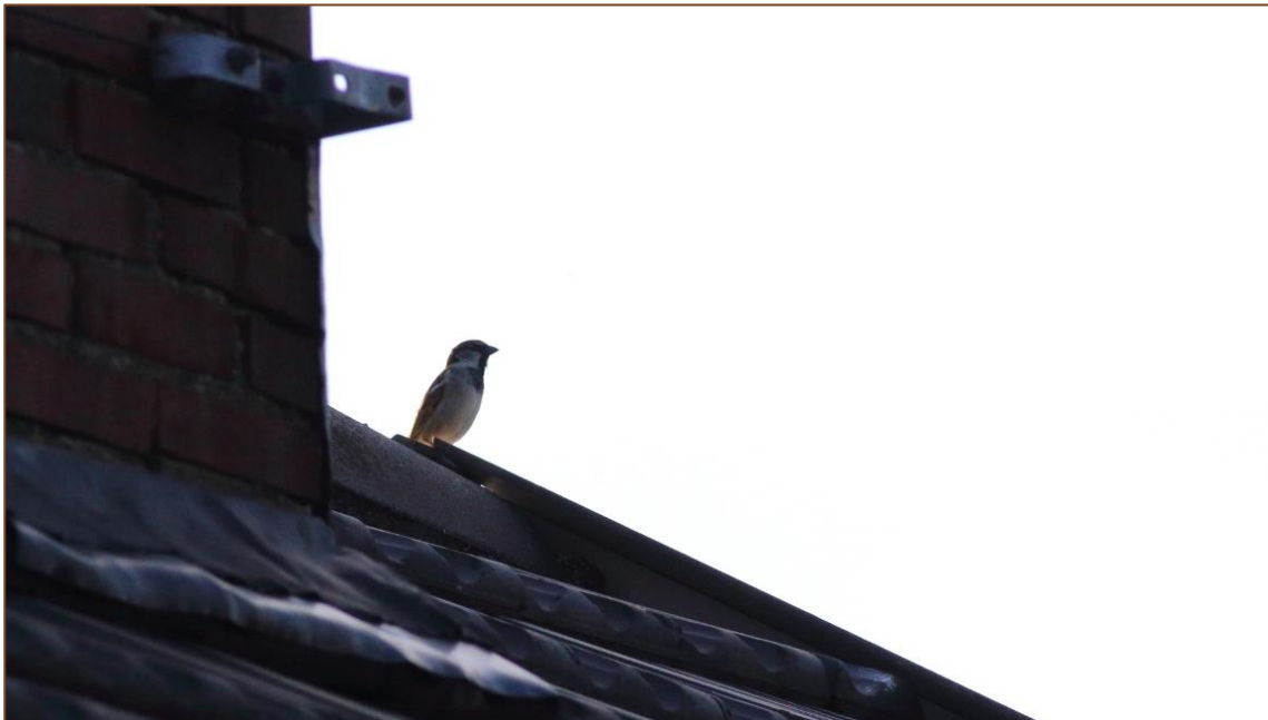
Foto 1. Zingend mannetje in plangebied, op 18 april.

In het plangebied zijn geen aanwijzingen gevonden dat er huismussen broeden. Er zijn geen in- of uitvliegende huismussen, transport van nestmateriaal, voedseltransport of pas uitgevlogen jongen of andere gedragingen waargenomen die wijzen op een nestlocatie. Eénmalig is een roepend mannetje vanaf het dak van de woning waargenomen. Deze huismus was kort ter plaatse en gebruikte de woning in het plangebied tijdelijk als zangpost (zie foto 1). Vervolgens vloog dit exemplaar weer naar de overzijde van de Doetinchemseweg, richting een haag van laurierkers op het erf van de Doetinchemseweg 12. Bij de overige veldbezoeken is geen enkele activiteit van huismussen in het plangebied waargenomen.