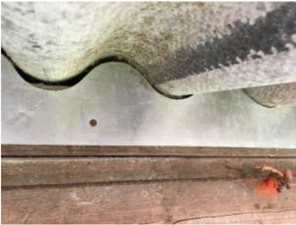
De holle ruimte tussen golfplaten en dakisolatie van de stallen is niet toegankelijk voor grondgebonden zoogdieren of vogels.

Er zijn in het plangebied geen beschermde grondgebonden zoogdieren waargenomen, maar gelet op de inrichting en het beheer van de buitenruimte, behoort deze tot functioneel leefgebied van beschermde grondgebonden zoogdiersoorten als huisspitsmuis, bosmuis, steenmarter, vos en haas. De gebouwen zijn niet toegankelijk voor grondgebonden zoogdieren, maar huisspitsmuizen en bosmuizen bezetten mogelijk een vaste rust- en voortplantingsplaats in hollen en gaten in de grond en onder rommel en opgeslagen (bouw)materialen.