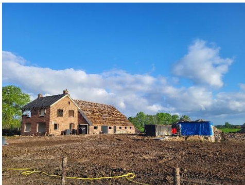
Huidige situatie; sloop bijna afgerond. Zichtbaar tijdens presentatie.

Het ontwerp wordt kort mondeling toegelicht. Het beeldmateriaal op papier en de locatie ter plekke brengen verdieping en verduidelijking.