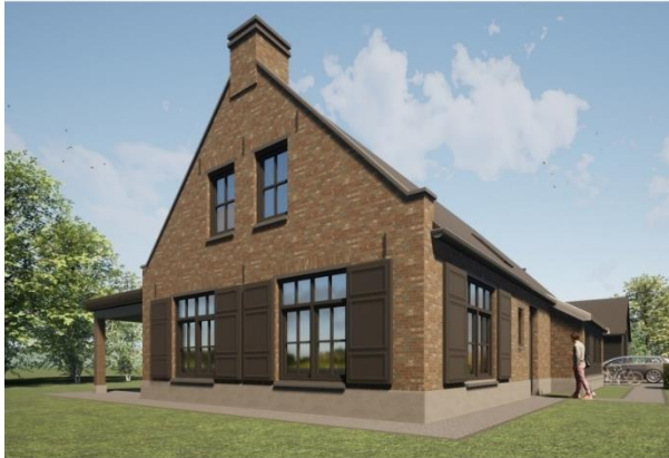
Impressie nieuw te bouwen woning