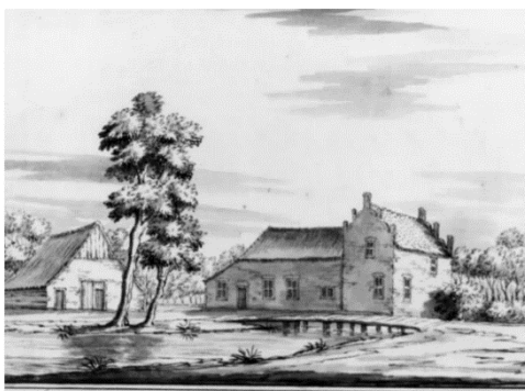
Havezathe " 't Huijs Schadewijk"

Inspiratie voor het ontwerp voor de te herbouwen woning