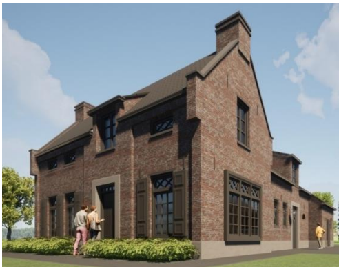
Impressie her te bouwen woning met een knip oog naar het verleden