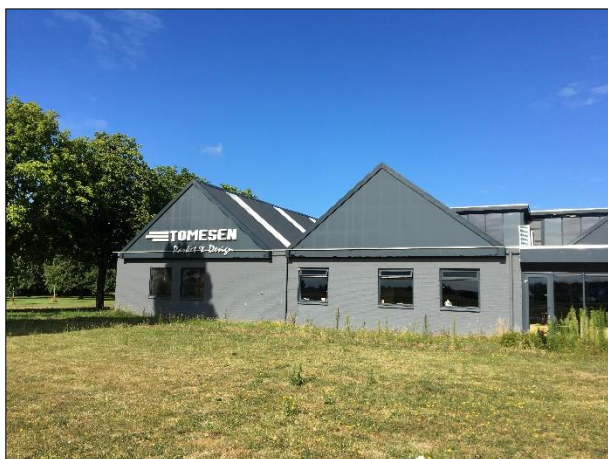
Potentiële nestlocatie van vogels in de bebouwing en in beplanting die langs de bebouwing staat.,

Het plangebied behoort tot functioneel leefgebied van verschillende vogelsoorten. Vogels benutten het plangebied als foerageergebied en vermoedelijk nestelen er jaarlijks vogels in het plangebied. Vogels kunnen een nestlocatie bezetten in de bebouwing en in beplanting die langs te slopen bebouwing staat. Vogelsoorten die mogelijk in het plangebied nestelen zijn merel, winterkoning, houtduif en witte kwikstaart. Er zijn tijdens het bezoek geen huismussen in het plangebied aangetroffen en er zijn geen geschikte nestlocaties voor deze soort aanwezig in de bebouwing. Tevens zijn er geen aanwijzingen aangetroffen dat huismussen een nestlocatie bezetten in de toonzaal die behouden blijft. Er zijn geen oude of potentiële nesten van roofvogels of uilen in de bebouwing of in beplanting in de omgeving van het plangebied waargenomen. Deze nesten zijn doorgaans gemakkelijk te vinden aan de hand van schijfsporen en braakballen. Het plangebied valt binnen het verspreidingsgebied van de steenuil maar er zijn geen aanwijzingen aangetroffen dat deze soort het plangebied benut als foerageergebied (NDFP, 2022).