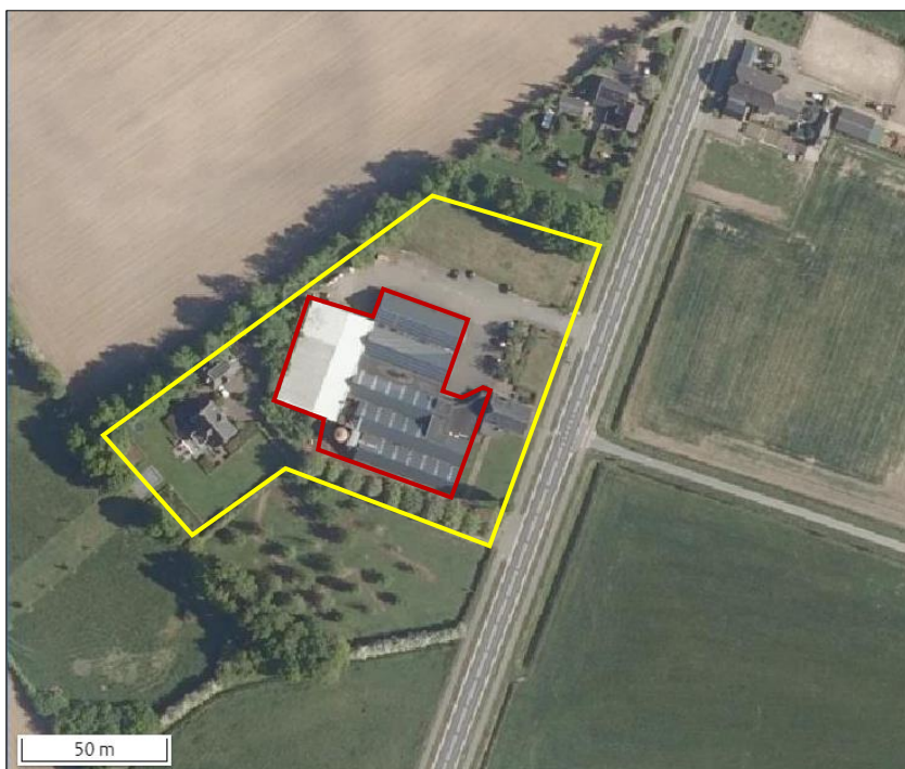
Begrenzing van het plangebied wordt met de gele lijn aangeduid. Met de rode lijnen worden de contouren van de te slopen bebouwing aangeduid.