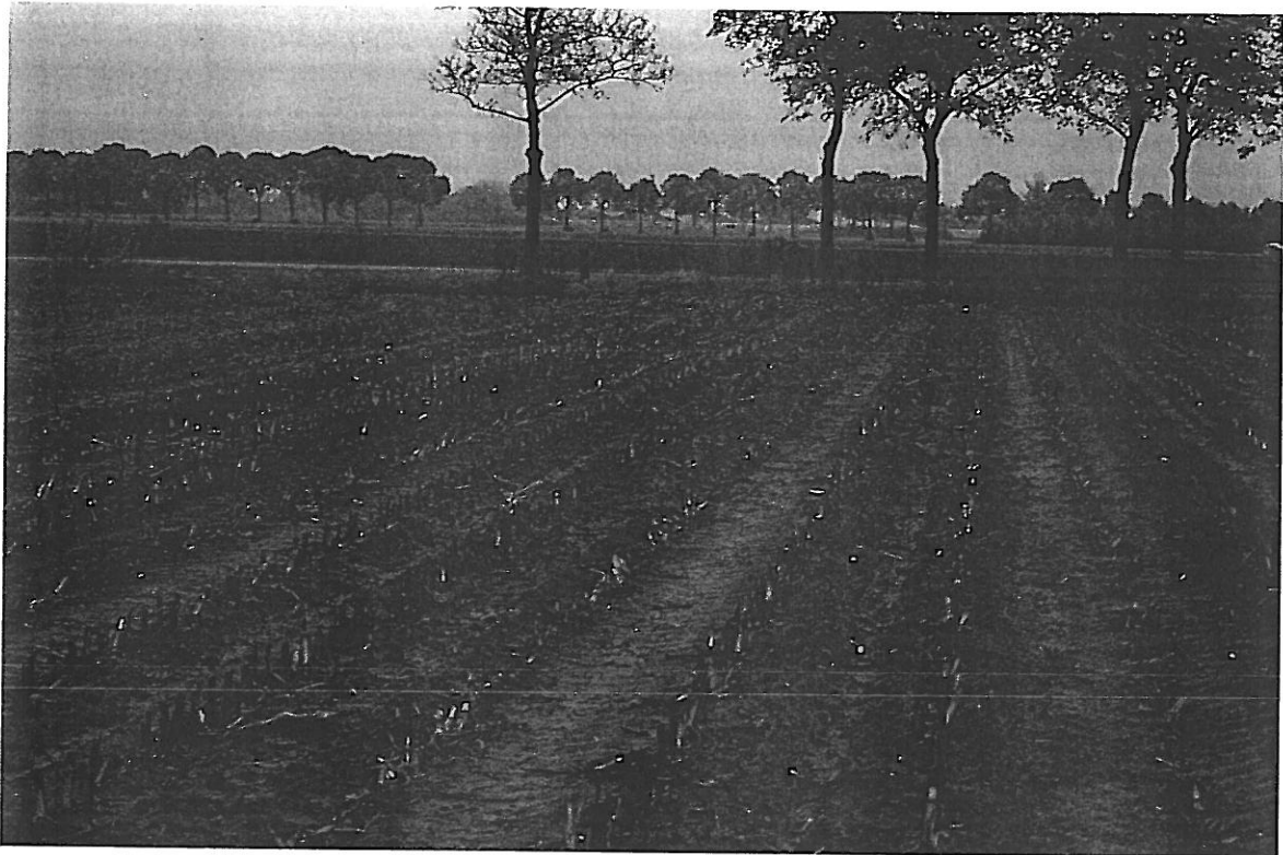
Foto 3. Plek waar de aan te leggen weg moet gaan aansluiten op een bestaande weg.