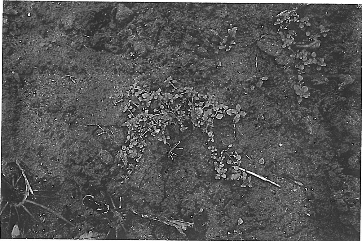
Foto 4. Vogelmuur. Een weinig waardevolle soort.