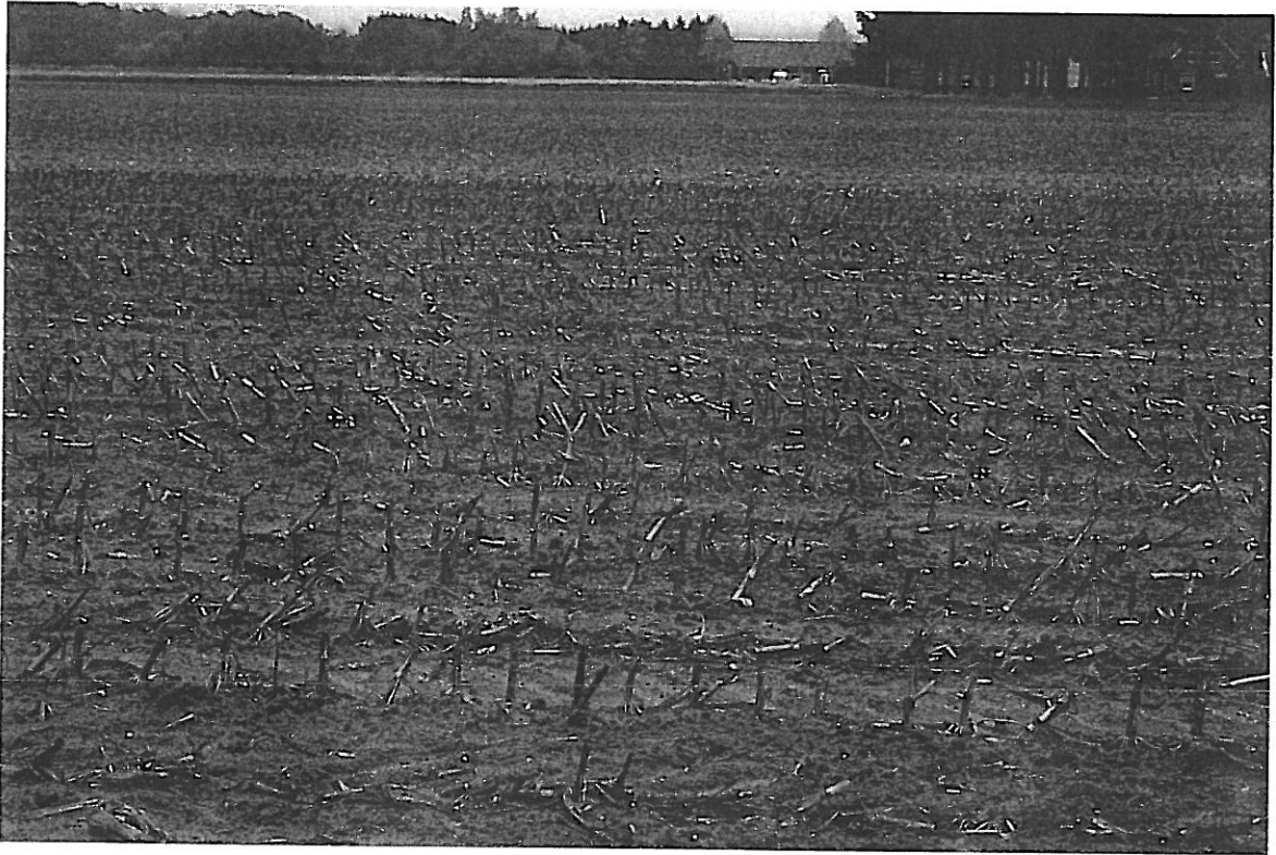
Foto 1. Overzicht perceel kadastrale Gemeente Bergh sectie A perceelnummer 964.