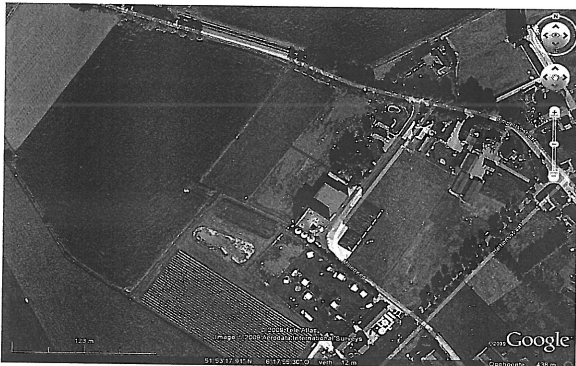
Afbeelding 1. Globale plaats waar de beoogde nieuwe weg zou moeten komen.

Om te bezien of er bij een de aanleg van een weg op een perceel (Kadastrale gemeente Bergh, sectie A, perceel nr 964 (afbeelding 2) bij de bestaande industriële opstallen van het veevoederbedrijf AgriGelre aan de Molenweg 9 te Azewijn ecologische schade zal optreden en of er voldaan wordt aan de eisen die de Flora- en Faunawet (FF-wet) stelt, heeft ondergetekende op verzoek van de heer Berntsen het beoogde perceel op 26 november bekeken.