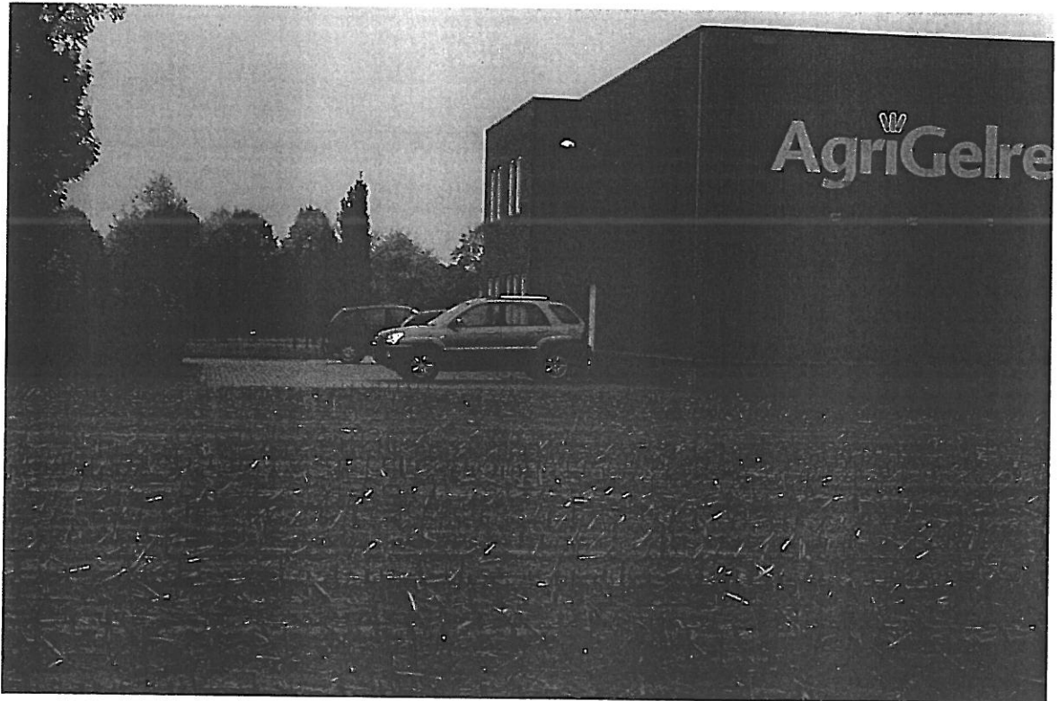
Foto 2. Deel van het perceel waar de aan te leggen weg moet aansluiten op de bestaande bestrating van AgriGelre.