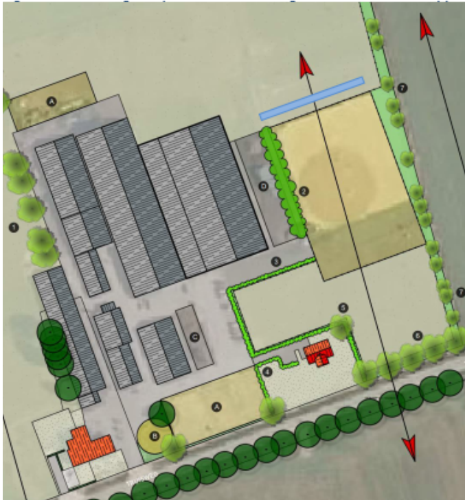
Afbeelding situering compenserende maatregel toename verhard oppervlak.

Het voornemen voorziet in een toename van het verhard oppervlakte met 2.700 m 2 . Op grond van het beleid van het waterschap brengt dit de noodzaak met zich mee om een compenserende maatregel met een capaciteit van 149 m 3 (2.700 * 0,055 liter water) aan te leggen. De initiatiefnemer wenst daartoe een brede sloot/langwerpige bergingsvijver aan te leggen, die gesitueerd wordt aan de noordkant van de buitenrijbak en volgens de hierna aan te geven dimensionering.