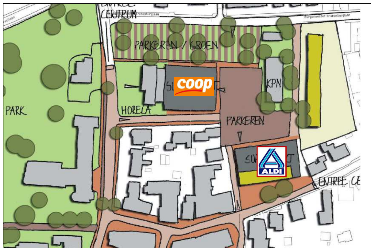
Figuur 2: Globale ligging van de nieuwe ontwikkeling

In de onderstaande figuur is de globale ligging van de nieuwe ontwikkeling weergegeven.