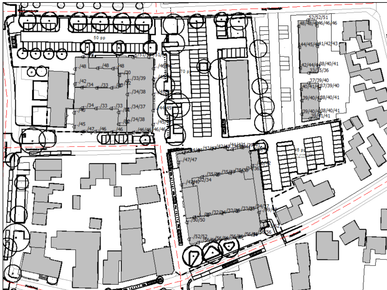
Figuur 2: Geluidsbelastingen afkomstig van de omliggende 30 km-wegen

De geluidsbelastingen afkomstig van de omliggende 30 km-wegen (Schoolstraat, Raadhuisstraat, Hoofdstraat, Burgemeester Kronenburglaan en Domineeskamplaan) zijn tezamen bepaald. In de onderstaande figuur zijn de geluidsbelastingen ( L_{den} ) weergegeven, inclusief aftrek op grond van artikel 110g Wgh van 5 dB, per verdieping (begane grond/eerste verdieping/tweede verdieping) afkomstig van de omliggende 30 km-wegen: