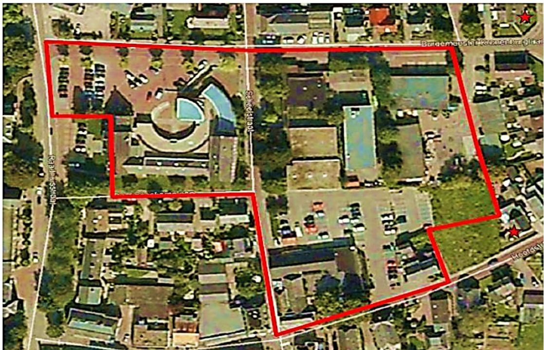
Figuur 1: Plangebied Raadhuisplein e.o. te Didam