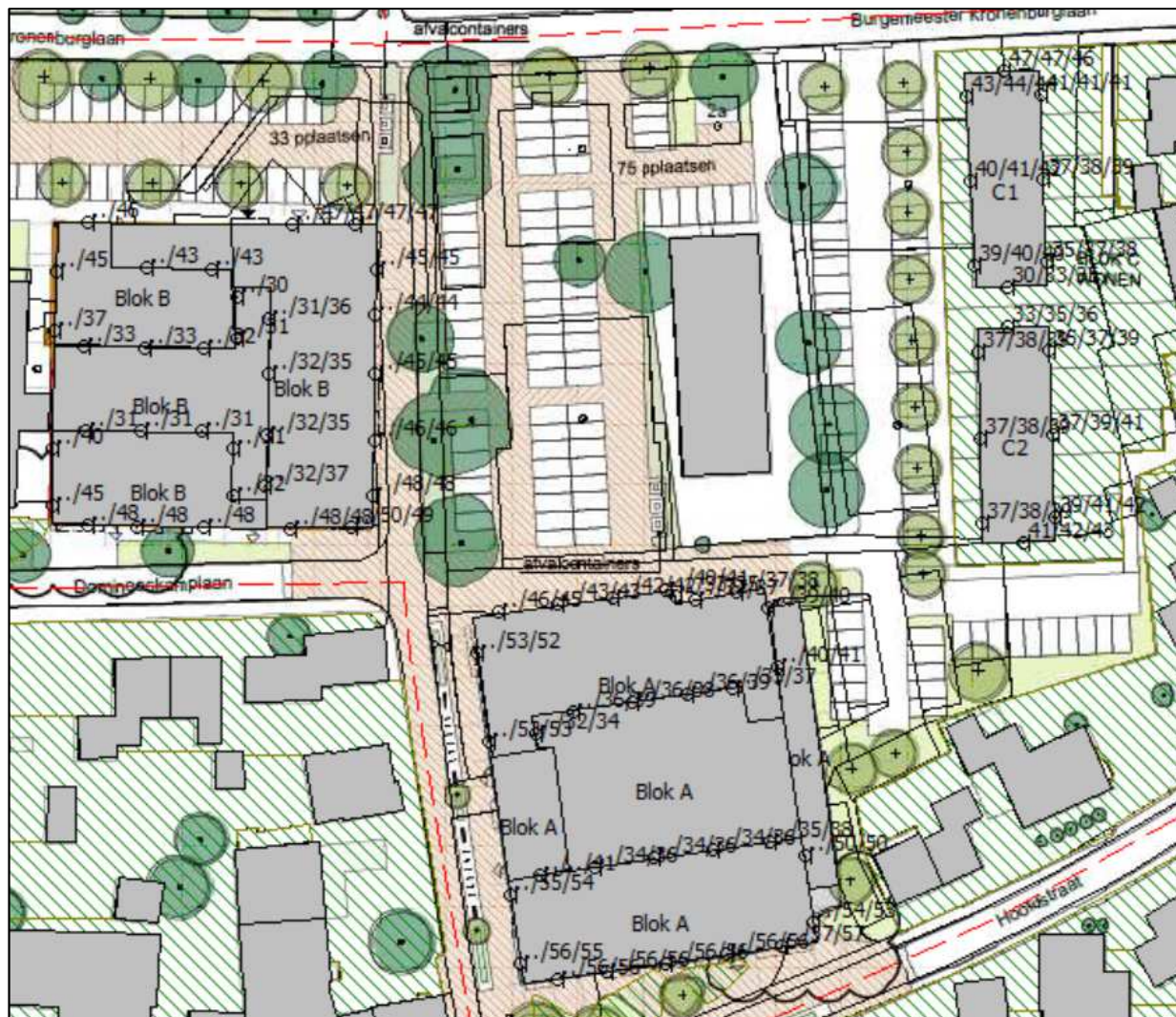
Figuur 2: Geluidsbelastingen afkomstig van de omliggende 30 km-wegen

De geluidsbelastingen afkomstig van de omliggende 30 km-wegen (Schoolstraat, Raadhuisstraat, Hoofdstraat, Burgemeester Kronenburglaan en Domineeskamplaan) zijn tezamen bepaald. In de onderstaande figuur zijn de geluidsbelastingen ( L_{den} ) weergegeven, inclusief aftrek op grond van artikel 110g Wgh van 5 dB, per verdieping (begane grond/eerste verdieping/tweede verdieping) afkomstig van de omliggende 30 km-wegen: